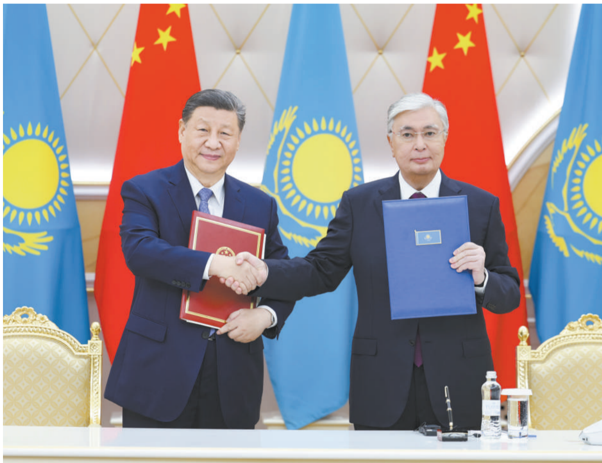
当地时间7月3日上午，国家主席习近平在阿斯塔纳总统府同哈萨克斯坦总统托卡耶夫举行会谈。会谈后，两国元首共同签署《中华人民共和国和哈萨克斯坦共和国联合声明》，并共同见证交换经贸、互联互通、航空航天、教育、媒体等领域数十项双边合作文件。

新华社阿斯塔纳7月3日电（记者倪四义 胡晓光 张继业）当地时间7月3日上午，国家主席习近平在阿斯塔纳总统府同哈萨克斯坦总统托卡耶夫举行会谈。