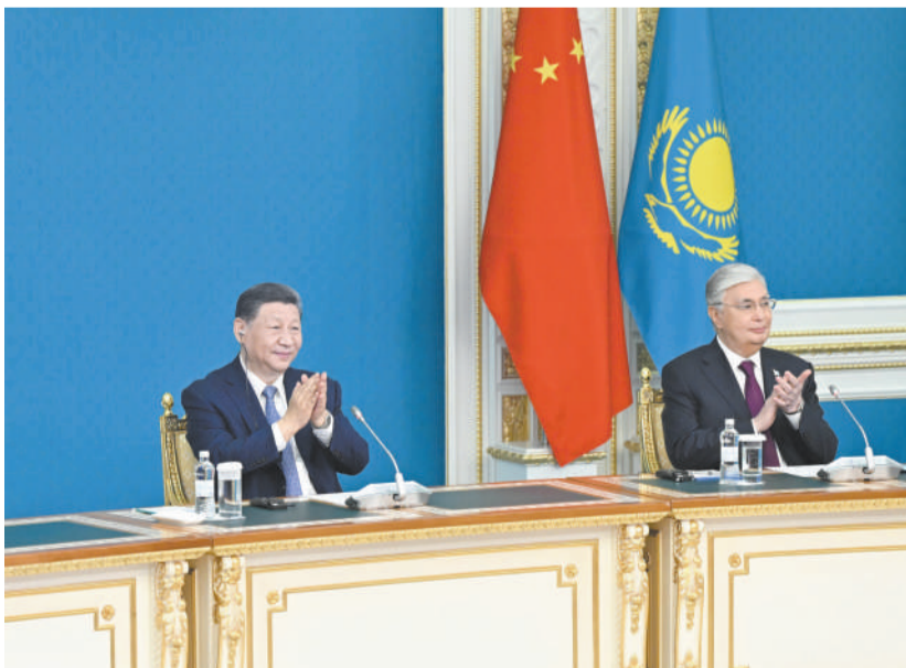
当地时间7月3日中午，国家主席习近平同哈萨克斯坦总统托卡耶夫在阿斯塔纳总统府以视频方式共同出席中欧跨里海直达快运开通仪式（拼版照片）。