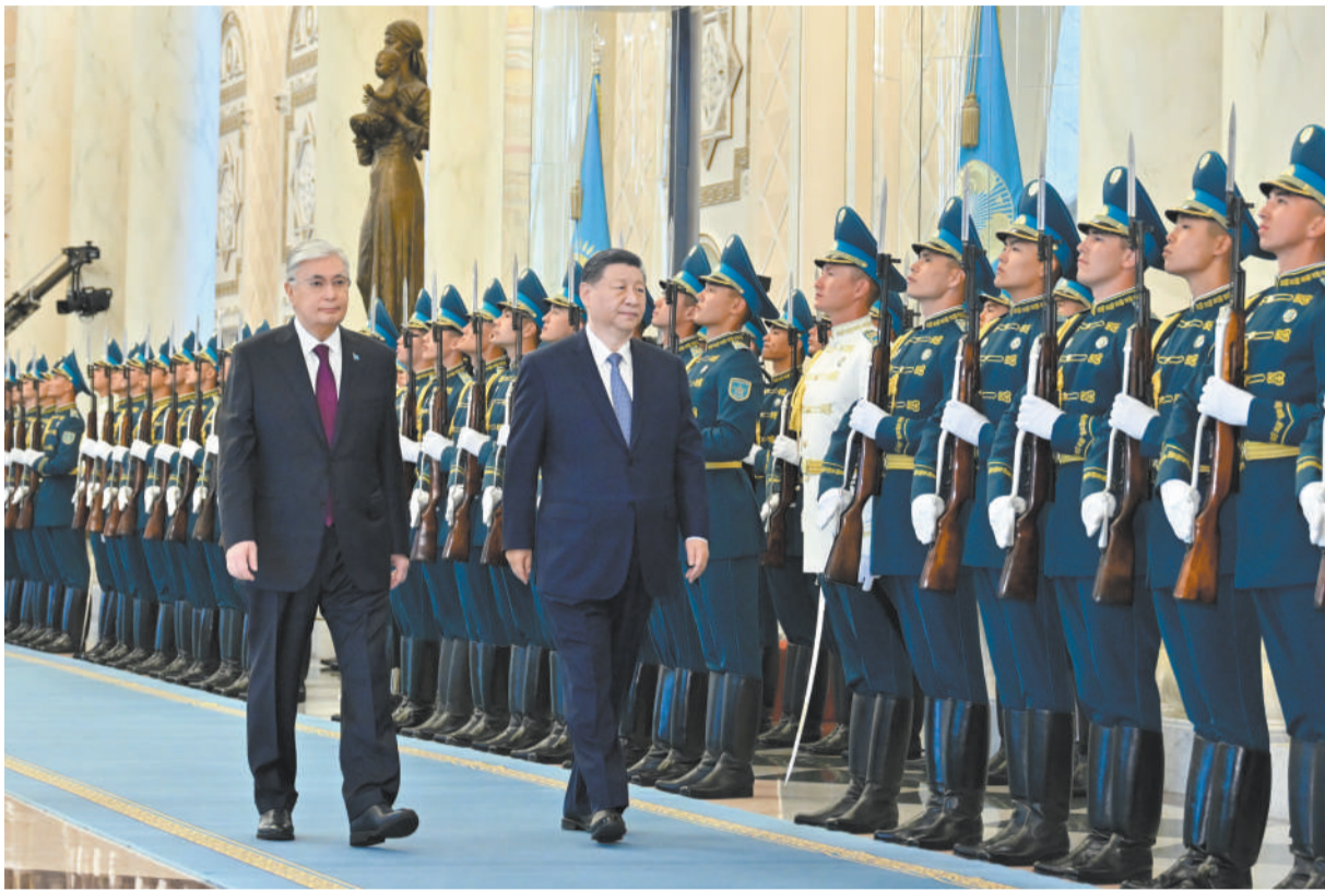
当地时间7月3日上午，国家主席习近平在阿斯塔纳总统府同哈萨克斯坦总统托卡耶夫举行会谈。托卡耶夫为习近平举行隆重欢迎仪式。这是习近平在托卡耶夫陪同下检阅仪仗队。