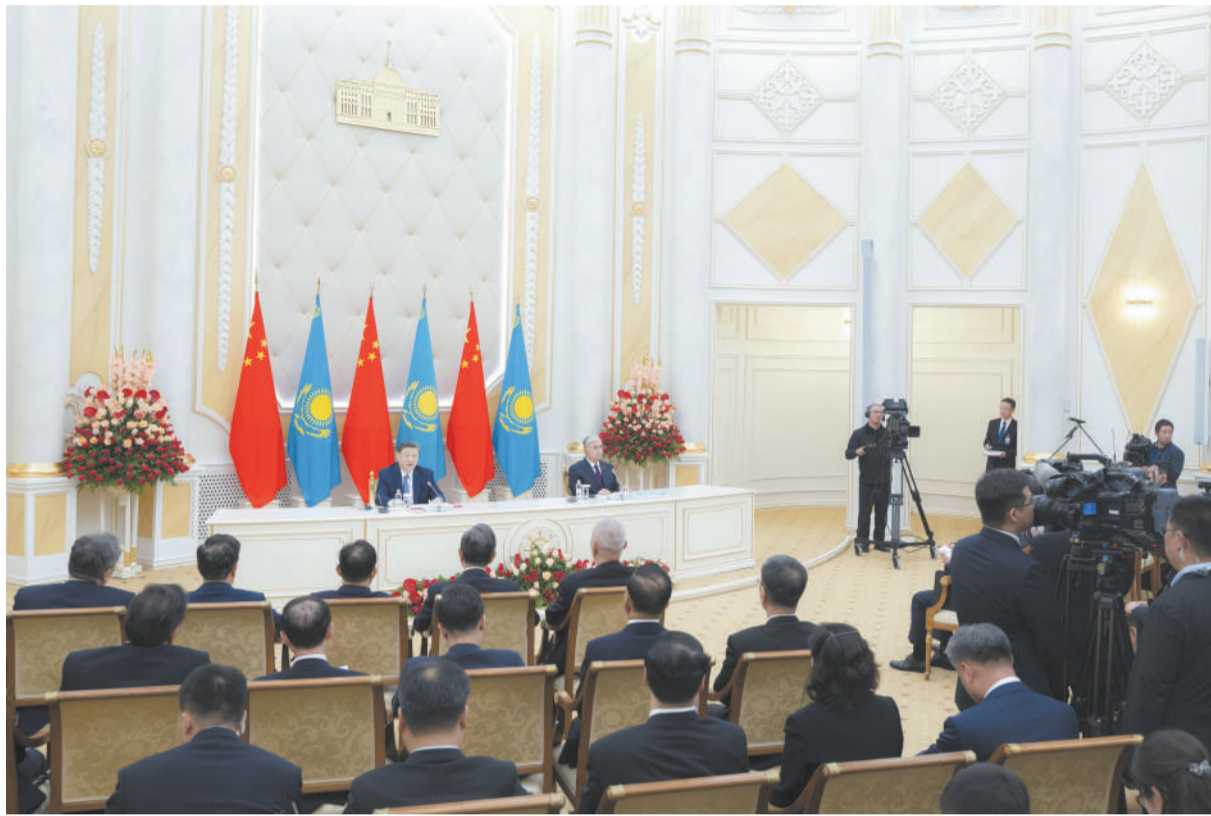
当地时间7月3日中午，国家主席习近平在阿斯塔纳总统府同哈萨克斯坦总统托卡耶夫会谈后共同会见记者。