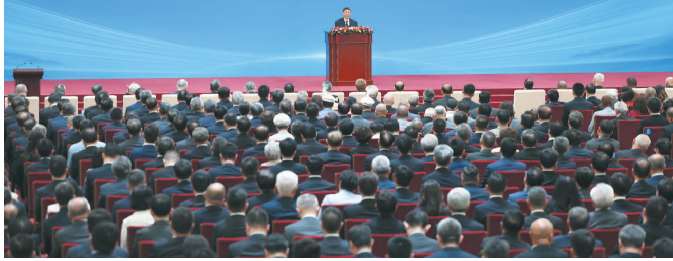
6月28日上午，和平共处五项原则发表70周年纪念大会在北京人民大会堂隆重举行。国家主席习近平出席纪念大会并发表题为《弘扬和平共处五项原则，携手构建人类命运共同体》的重要讲话。

新华社北京6月28日电（记者孙奕 马卓言）6月28日上午，和平共处五项原则发表70周年纪念大会在北京人民大会堂隆重举行。国家主席习近平出席纪念大会并发表题为《弘扬和平共处五项原则，携手构建人类命运共同体》的重要讲话。 仲夏时节，天高云淡。人民大会堂金色大厅，庄严辉煌，高朋满座。上午十时许，在恢弘的《和平—命运共同体》乐曲声中，习近平步入金色大厅。 习近平出席纪念大会的各国政要一一握手，亲切互动。 在热烈的掌声中，习近平发表重要讲话。 习近平指出，在近现代人类社会发展的历史进程中，处理国与国关系、共同维护世界和平与安宁，促进全人类