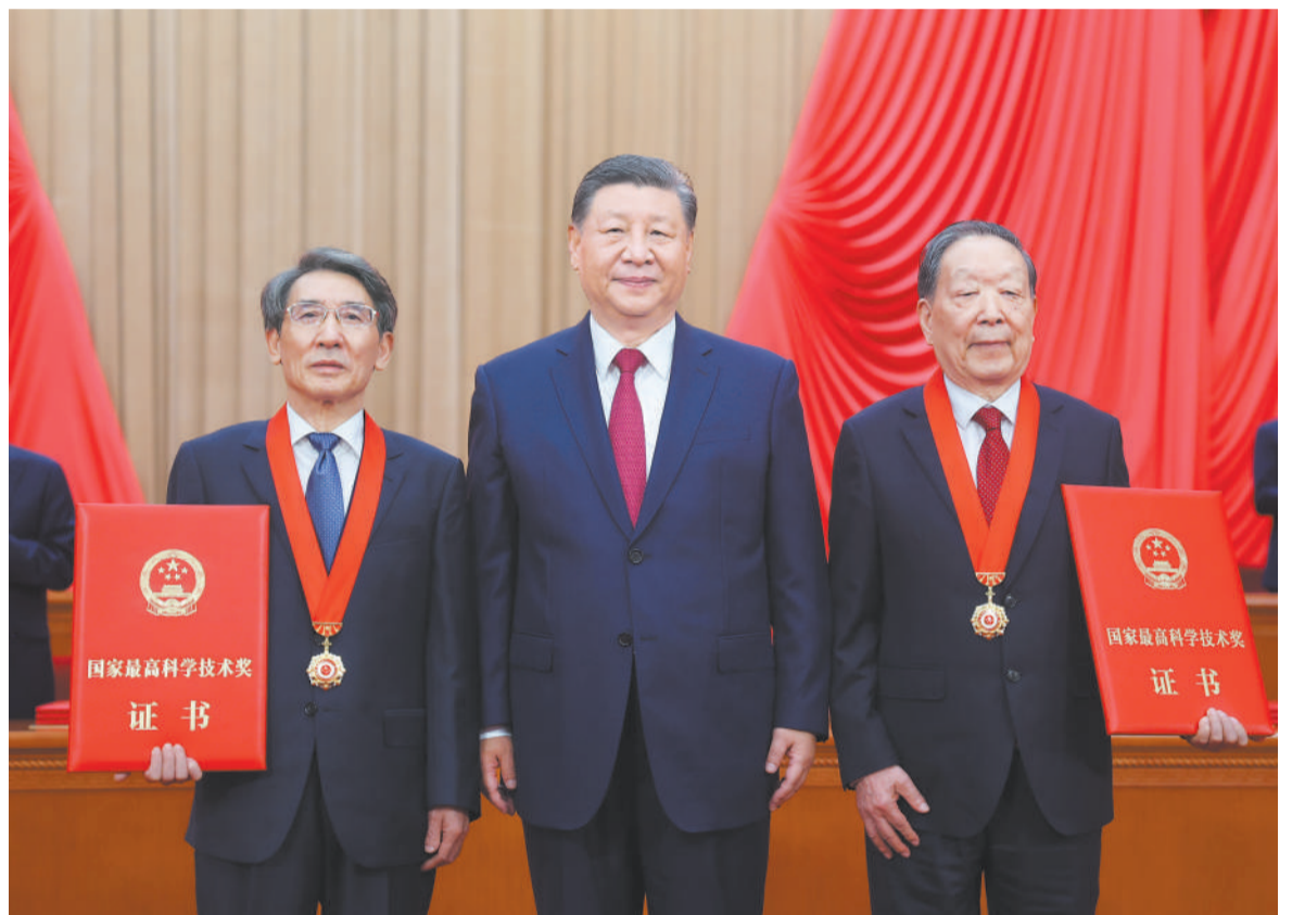
六月二十四日，全国科技大会、国家科学技术奖励大会和中国工程院第二十七次院士大会、中国科学院第十七次院士大会在北京人民大会堂隆重召开。中共中央总书记、国家主席、中央军委主席习近平向获得二〇二三年度国家最高科学技术奖的武汉大学李德仁院士和清华大学薛其坤院士（左）颁奖。

新华社北京6月24日电 全国科技大会、国家科学技术奖励大会和中国工程院第二十七次院士大会、中国科学院第十七次院士大会24日上午在人民大会堂隆重召开。中共中央总书记、国家主席、中央军委主席习近平出席大会，为国家最高科学技术奖获得者等颁奖并发表重要讲话。他强调，科技兴则民族兴，科技强则国家强。中国式现代化要靠科技现代化作支撑，实现高质量发展要靠科技创新培育新动能。必须充分认识科技的战略先导地位和根本支撑作用，锚定2035年建成科技强国的战略目标，加强顶层设计和统筹谋划，加快实现高水平科技自立自强。