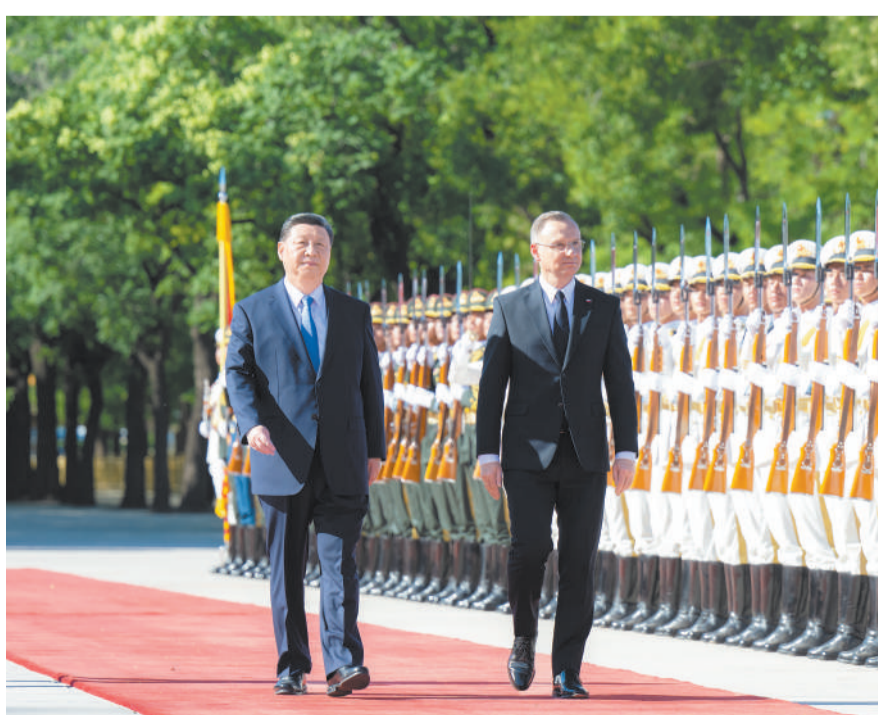
6月24日下午，国家主席习近平在北京人民大会堂同来华进行国事访问的波兰总统杜达举行会谈。这是会谈前，习近平在人民大会堂东门外广场为杜达举行欢迎仪式。