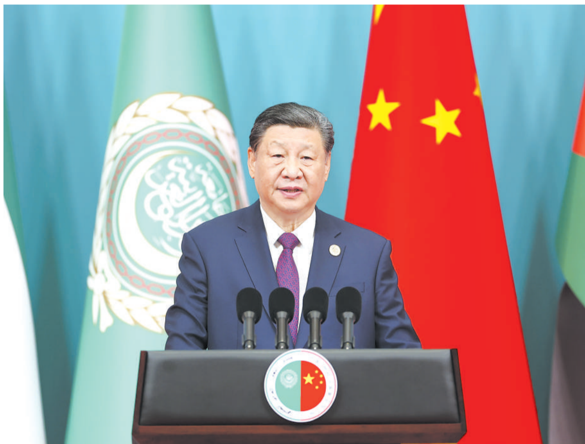
5月30日上午，国家主席习近平在北京钓鱼台国宾馆出席中阿合作论坛第十届部长级会议开幕式并发表主旨讲话。