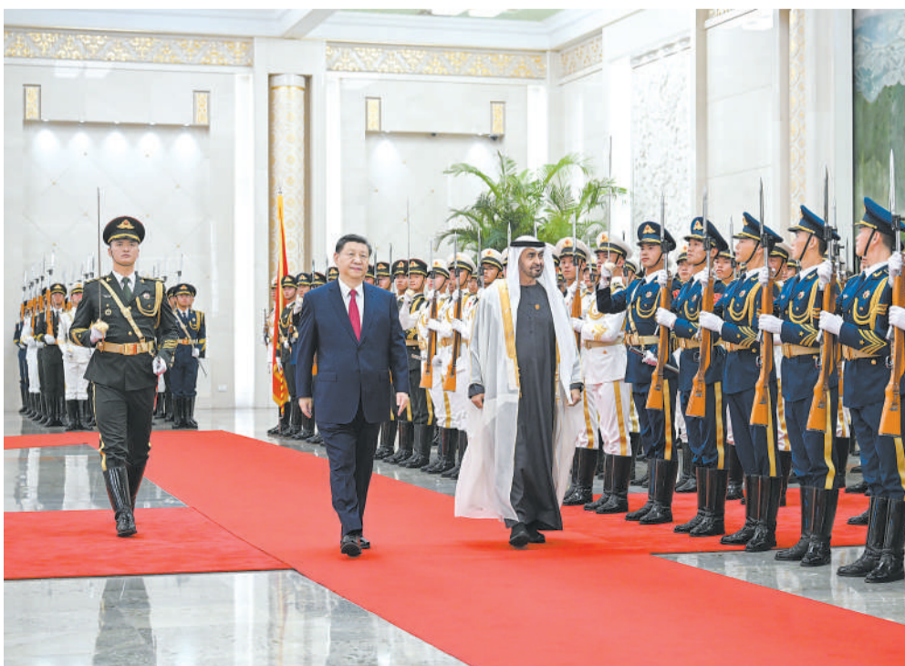
5月30日下午，国家主席习近平在北京人民大会堂同来华国事访问并出席中国—阿拉伯国家合作论坛第十届部长级会议开幕式的阿联酋总统穆罕默德举行会谈。这是会谈前，习近平在人民大会堂北大厅为穆罕默德举行欢迎仪式。