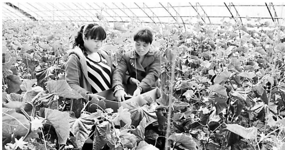
工人在山西省大同市阳高县狮子屯乡东寨寨宝红农业产业园区采摘黄瓜。

大同市相关负责人介绍，系列项目建成后，大同市将形成一批集育苗、种植、营销、科研等多元产业于一体的高端示范园区。未来，大同市将打造成蔬菜产销集散中心及直通俄罗斯等中东欧国家的种植基地，辐射带动1.3万农户增收。