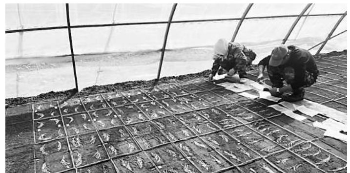
内蒙古兴安安粮优质品种科技研究所工作人员正在育种。

多年来，扎赉特旗将水稻科学育种和打造区域优质品牌作为区域创新工作的重中之重。截至目前，柳玉山带领团队育成审定水稻优良品种19个，每年在内蒙古、吉林、黑龙江三省（区）稻区推广种植面积100多万亩。每年这三省（区）稻区6000户农民总计增收达5400万元，稻米企业增加效益7700万元。