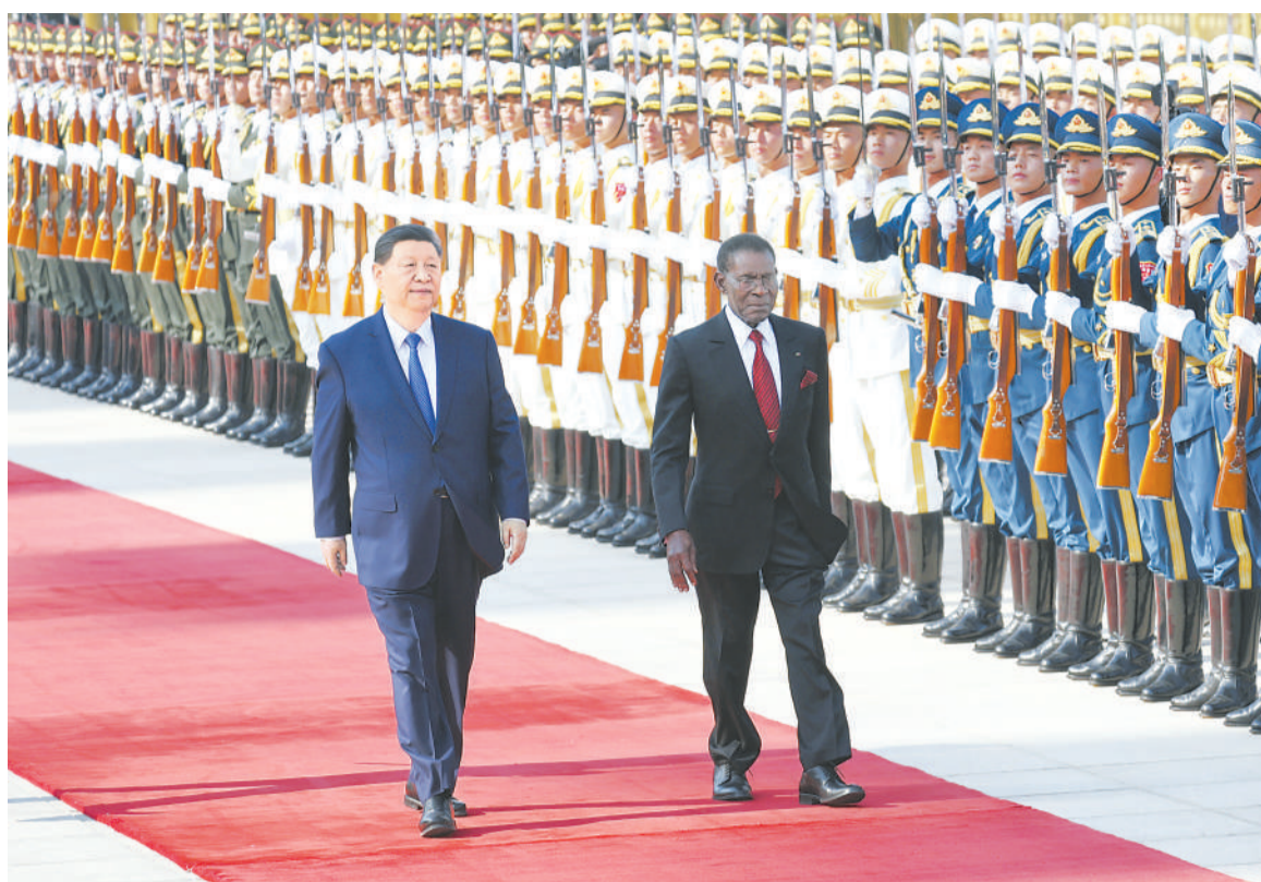
五月二十八日下午，国家主席习近平在北京人民大会堂同赤道几内亚总统奥比昂举行会谈。这是会谈前，习近平在人民大会堂东门外广场为奥比昂举行欢迎仪式。