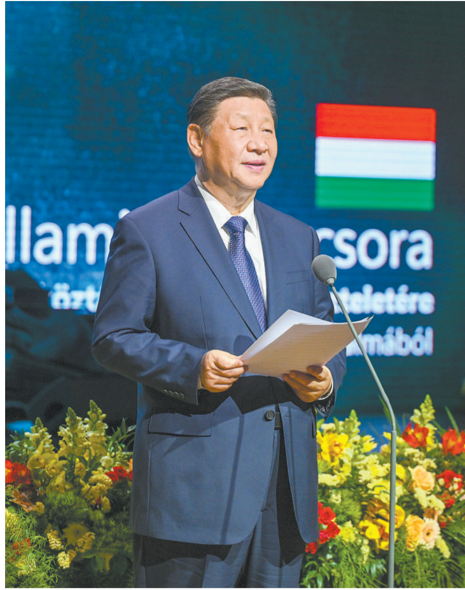
当地时间五月九日晚，国家主席习近平和夫人彭丽媛在布达佩斯城堡山出席匈牙利总理欧尔班和夫人举行的隆重欢迎宴会。这是习近平在宴会上致辞。

习近平主席夫人彭丽媛，中共中央政治局常委、中央办公厅主任蔡奇，中共中央政治局委员、外交部部长王毅等陪同人员同机返回。