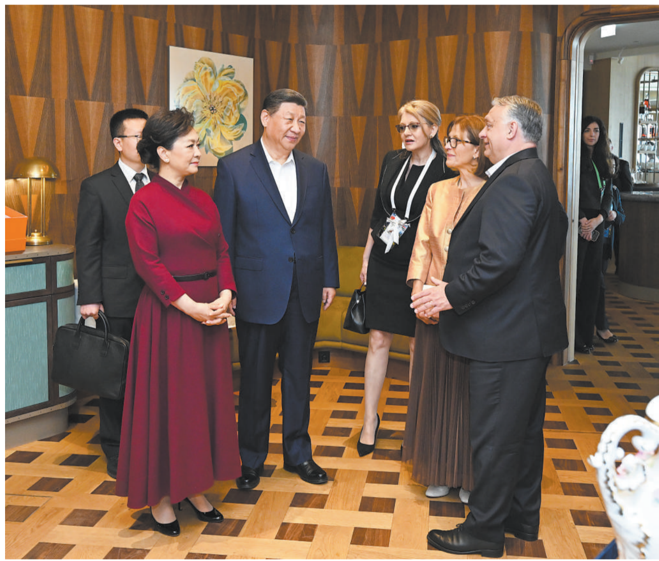
当地时间5月10日中午，国家主席习近平和夫人彭丽媛在布达佩斯应邀出席匈牙利总理欧尔班和夫人举行的饯行活动。