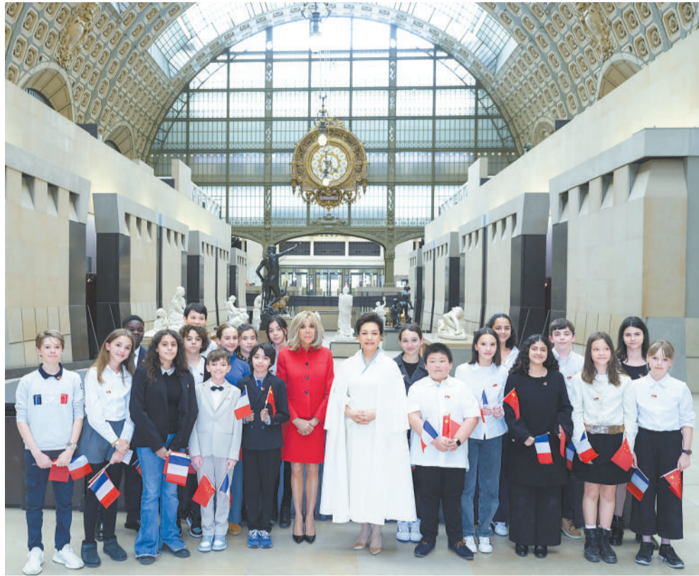
当地时间5月6日下午,国家主席习近平夫人彭丽媛在巴黎应邀同法国总统马克龙夫人布丽吉特共同参观奥赛博物馆。