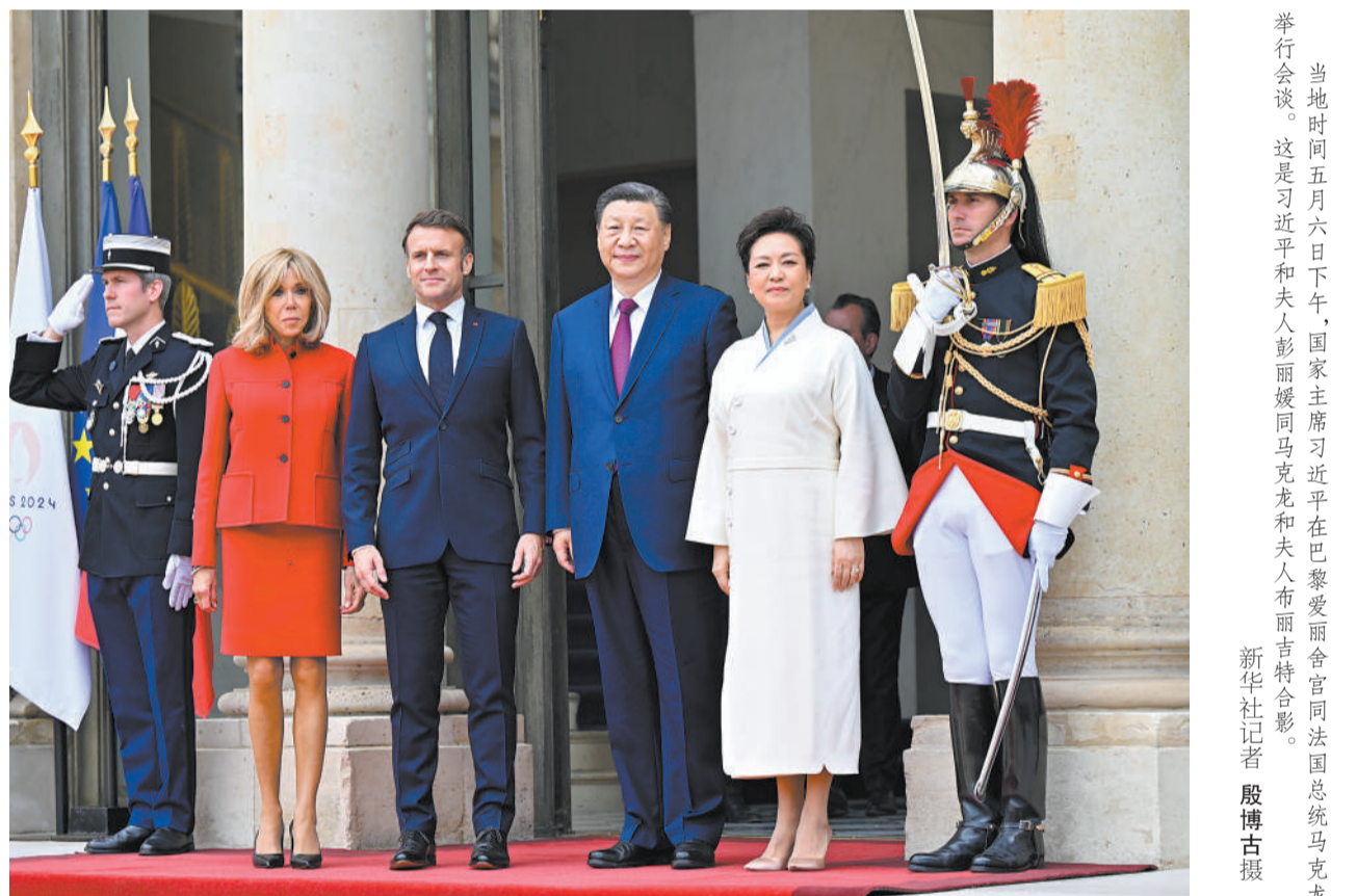
当地时间五月六日下午，国家主席习近平在巴黎爱丽舍宫同法国总统马克龙举行会谈。这是习近平和夫人彭丽媛同马克龙和夫人布丽吉特合影。