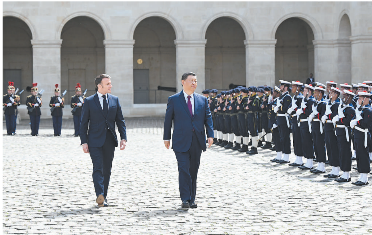
当地时间5月6日下午，正在法国进行国事访问的国家主席习近平在巴黎出席法国总统马克龙举行的隆重盛大欢迎仪式。这是两国元首检阅法兰西共和国卫队和陆海空三军仪仗队。

旗和蓝白红三色旗迎风飘扬。习近平和夫人彭丽媛乘车抵达时，马克龙和夫人布丽吉特在下车处热情迎接。在雄壮的进行曲中，两国元首步入广场。军乐团奏中法两国国歌。两国元首检阅法兰西共和国卫队和陆海空三军仪仗队，并观看分列式。随后，