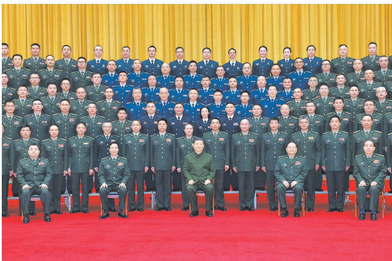
3月18日至21日,中共中央总书记、国家主席、中央军委主席习近平在湖南考察。这是20日上午,习近平在长沙亲切接见驻长沙部队上校以上领导干部,代表党中央和中央军委向驻长沙部队全体官兵致以诚挚问候。

习近平强调,湖南要更好担负起新的文化使命,在建设中华民族现代文明中展现新作为。保护好、运用好红色资源,加强革命传统和爱国主义教育,引导广大干部群众发扬优良传统,赓续红色血脉,践行社会主义核心价值观,培育时代新风