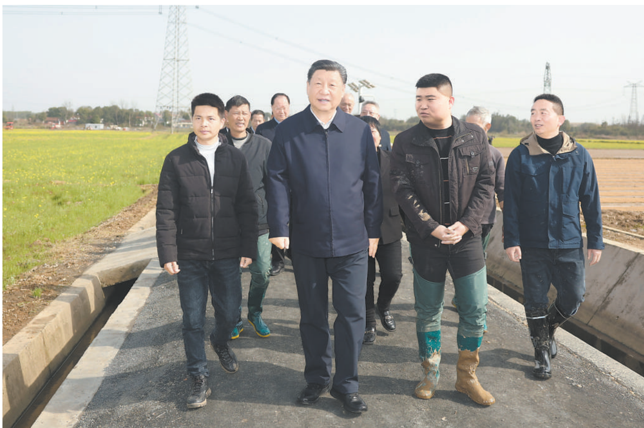
3月18日至21日,中共中央总书记、国家主席、中央军委主席习近平在湖南考察。这是19日下午,习近平在常德市鼎城区谢家铺镇港中坪村,同种粮大户、农技人员、基层干部亲切交流。

新华社长沙3月21日电 中共中央总书记、国家主席、中央军委主席习近平近日在湖南考察时强调,湖南要牢牢把握自身在构建新发展格局中的战略定位,坚持稳中求进工作总基调,坚持高质量发展不动摇,坚持改革创新、求真务实,在打造国家重要先进制造业高地、具有核心竞争力的科技创新高地、内陆地区改革开放高地上持续用力,在推动中部地区崛起和长江经济带发展中奋勇争先,奋力谱写中国式现代化湖南篇章。