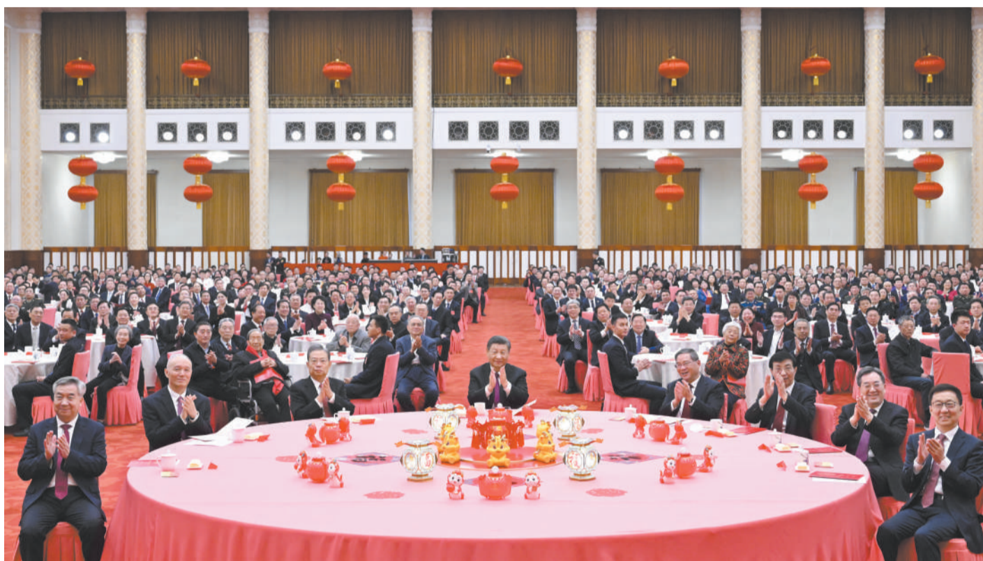
2月8日,中共中央、国务院在北京人民大会堂举行2024年春节团拜会。中共中央总书记、国家主席、中央军委主席习近平发表讲话。