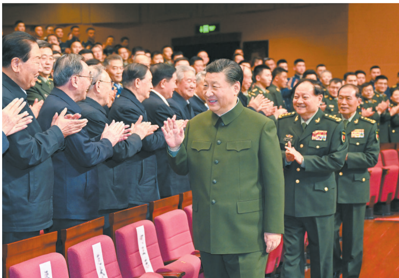
1月29日下午，中央军委慰问驻京部队老干部迎新春文艺演出在京举行。中共中央总书记、国家主席、中央军委主席习近平观看演出，向在座的军队老同志和全军离退休老干部致以节日问候和新春祝福。

新华社北京1月30日电（记者梅常伟）中央军委慰问驻京部队老干部迎新春文艺演出29日在京举行。中共中央总书记、国家主席、中央军委主席习近平观看演出，向在座的军队老同志和全军离退休老干部致以节日问候和新春祝福。战歌嘹亮迎新春，强军奋进新征程。中华民族传统节日春节即将到来之际，为建立、保卫、建设新中国，为国防和军队建设作出突出贡献的驻京部队老干部在中国剧院欢聚一堂，喜迎新春佳节。下午4时许，习近平来到老同志中间，全场响起热烈掌声。习近平亲切询问他们的身体和生活情况，共同回顾在