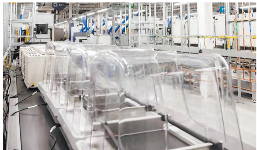
人工智能进行化学研究的概念呈现。

还需要注意的是,现实世界中的研究问题,很多都比这一研究中的实验复杂得多。有些研究涉及化学以外的学科概念,如药物开发中需应用到生物学。Coscientist目前还无法解决这一领域的复杂问题。