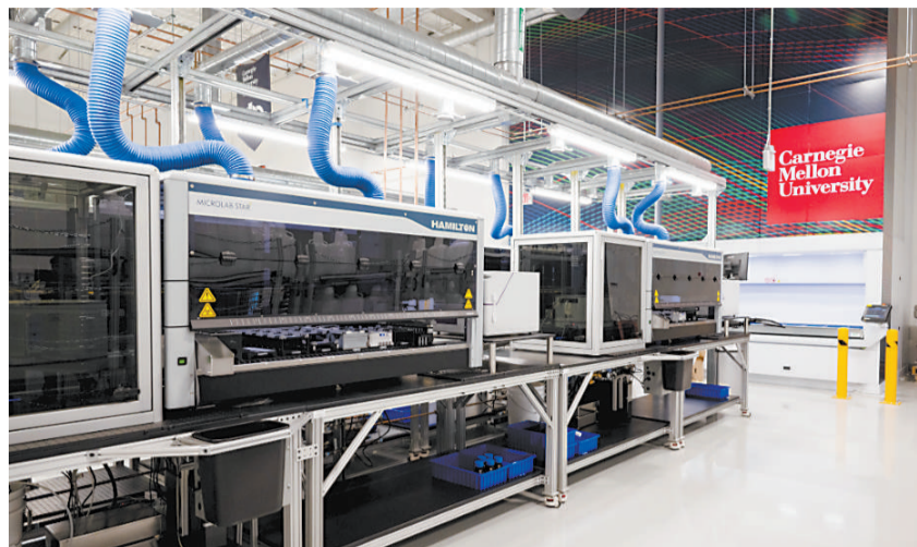
卡内基梅隆大学的云实验室。

2010年,诺贝尔化学奖授予3位化学家,以表彰他们提出钯催化交叉偶联反应。这类反应的实用度非常高,因为其可高效构建碳-碳键,轻易生成许多