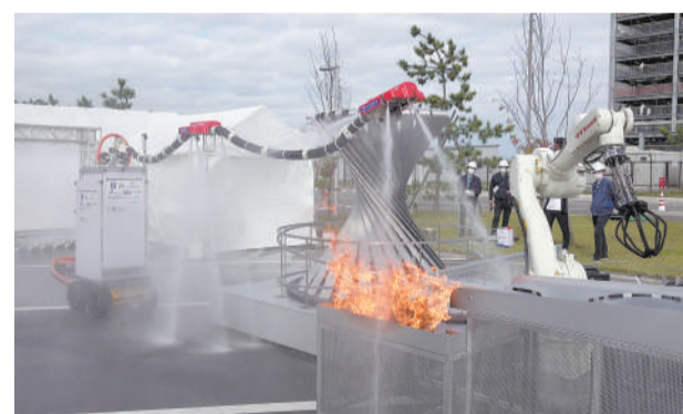
“龙消防员”在日本福岛举行的世界机器人峰会开幕式上进行表演(资料照片)。

不过,该机器人设计仍有局限。如对“龙消防员”的被动减振机制仍未落实,这导致其准备飞行的时间过长。在户外应用中,火灾产生的热量会导致包裹水管和电缆的波纹管产生变形。