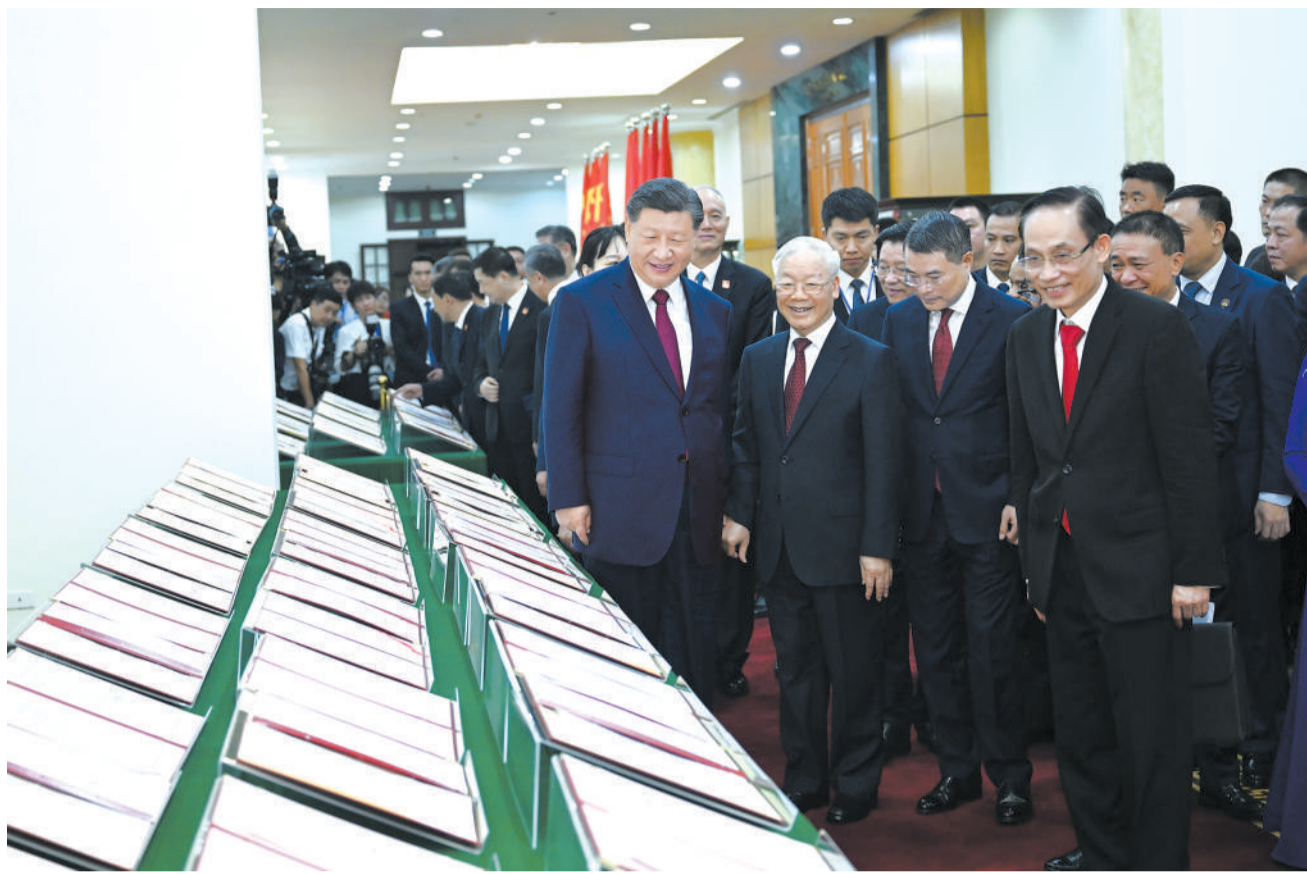
当地时间12月12日下午，刚刚抵达河内的中共中央总书记、国家主席习近平在越共中央总书记阮富仲举行会谈。这是会谈后，两党总书记共同见证双方签署的双边合作文件展示。