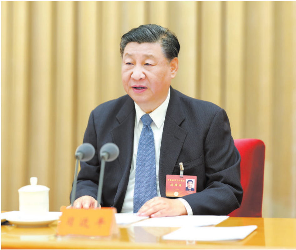
12月11日至12日，中央经济工作会议在北京举行。中共中央总书记、国家主席、中央军委主席习近平出席会议并发表重要讲话。

新华社北京12月12日电 中央经济工作会议12月11日至12日在北京举行。中共中央总书记、国家主席、中央军委主席习近平出席会议并发表重要讲话。中共中央政治局常委李强、赵乐际、王沪宁、蔡奇、丁薛祥、李希出席会议。