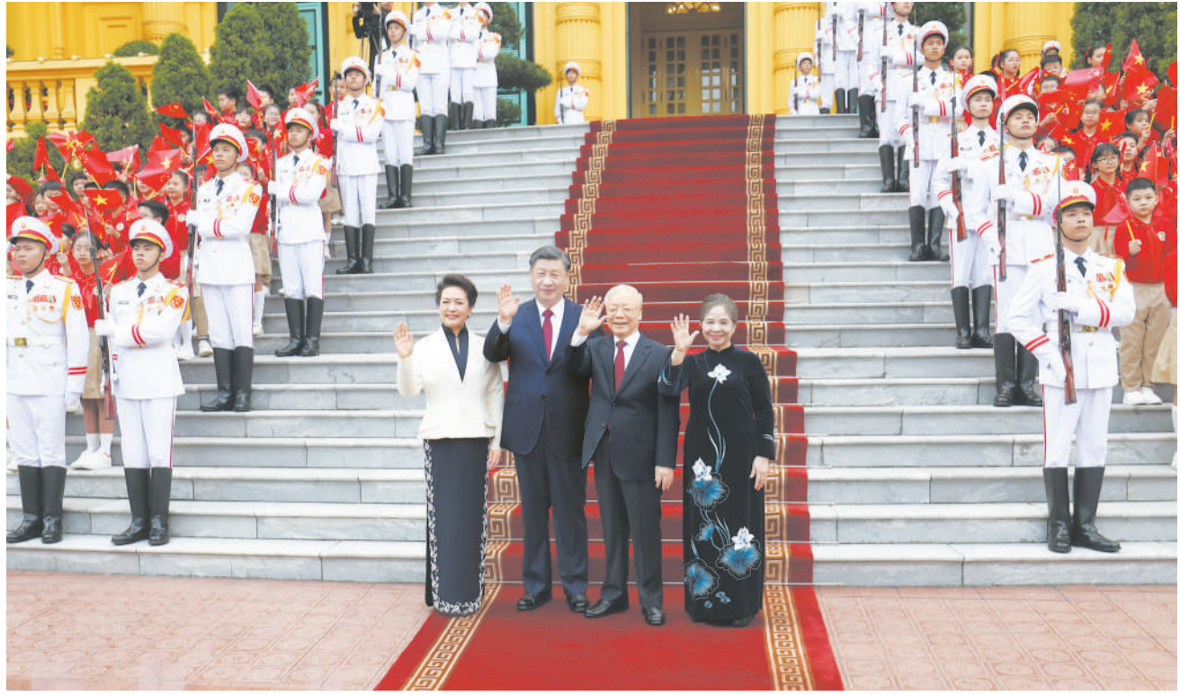
当地时间12月12日下午，刚刚抵达河内的中共中央总书记、国家主席习近平在越共中央驻地同越共中央总书记阮富仲举行会谈。这是阮富仲在主席府广场为习近平举行隆重欢迎仪式。