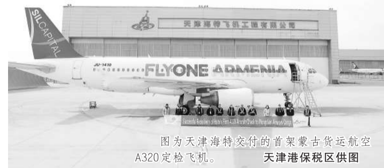
图为天津海特交付的首架蒙古货运航空A320定检飞机。

近年来,天津港保税区坚持推动落实航空产业补链、延链、强链,积极承接国家战略任务,不断完善产业生态,使区域航空产业实现快速发展。依托雄厚的产业基础,天津港保税区积极推动整机维修、客改货、部附件维修、发动机维修等业务发展,聚集了一批航空维修项目。下一步,天津港保税区将聚焦航空制造、航空维修、航空服务和航空物流四个重点领域,不断提升航空产业链、价值链和创新链层级,推动更多重大项目落地发展,加快打造中国航空产业发展新高地。