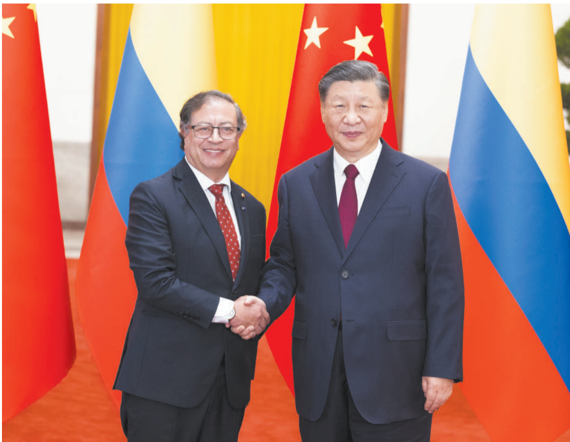
十月二十五日下午，国家主席习近平在北京人民大会堂同来华进行国事访问的哥伦比亚总统佩特罗举行会谈。这是会谈前，习近平在人民大会堂北大厅为佩特罗举行欢迎仪式。