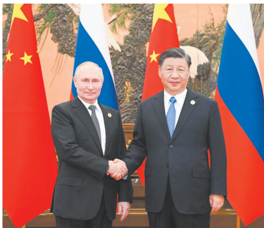
10月18日中午,国家主席习近平在北京人民大会堂同来华出席第三届“一带一路”国际合作高峰论坛的俄罗斯总统普京举行会谈。

习近平指出,不久前,金砖国家实现历史性扩员,展现了发展中国家推动世界多极化、国际关系民主化的信心。中方支持俄方明年办好金砖国家领导人喀山会晤,愿同俄方继续