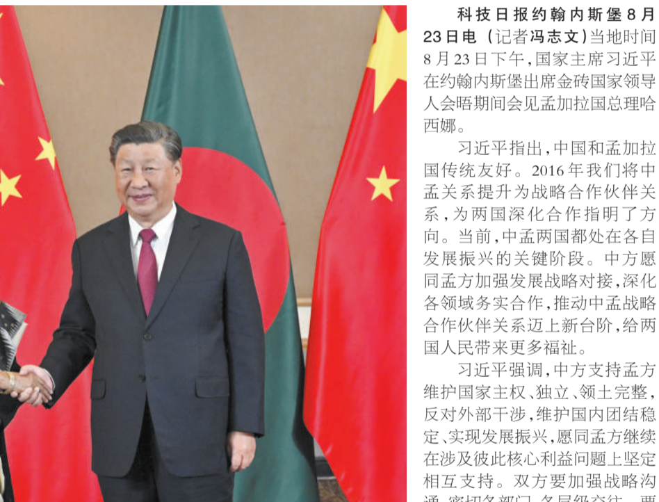
当地时间8月23日下午，国家主席习近平在约翰内斯堡出席金砖国家领导人会晤期间会见孟加拉国总理哈西娜。