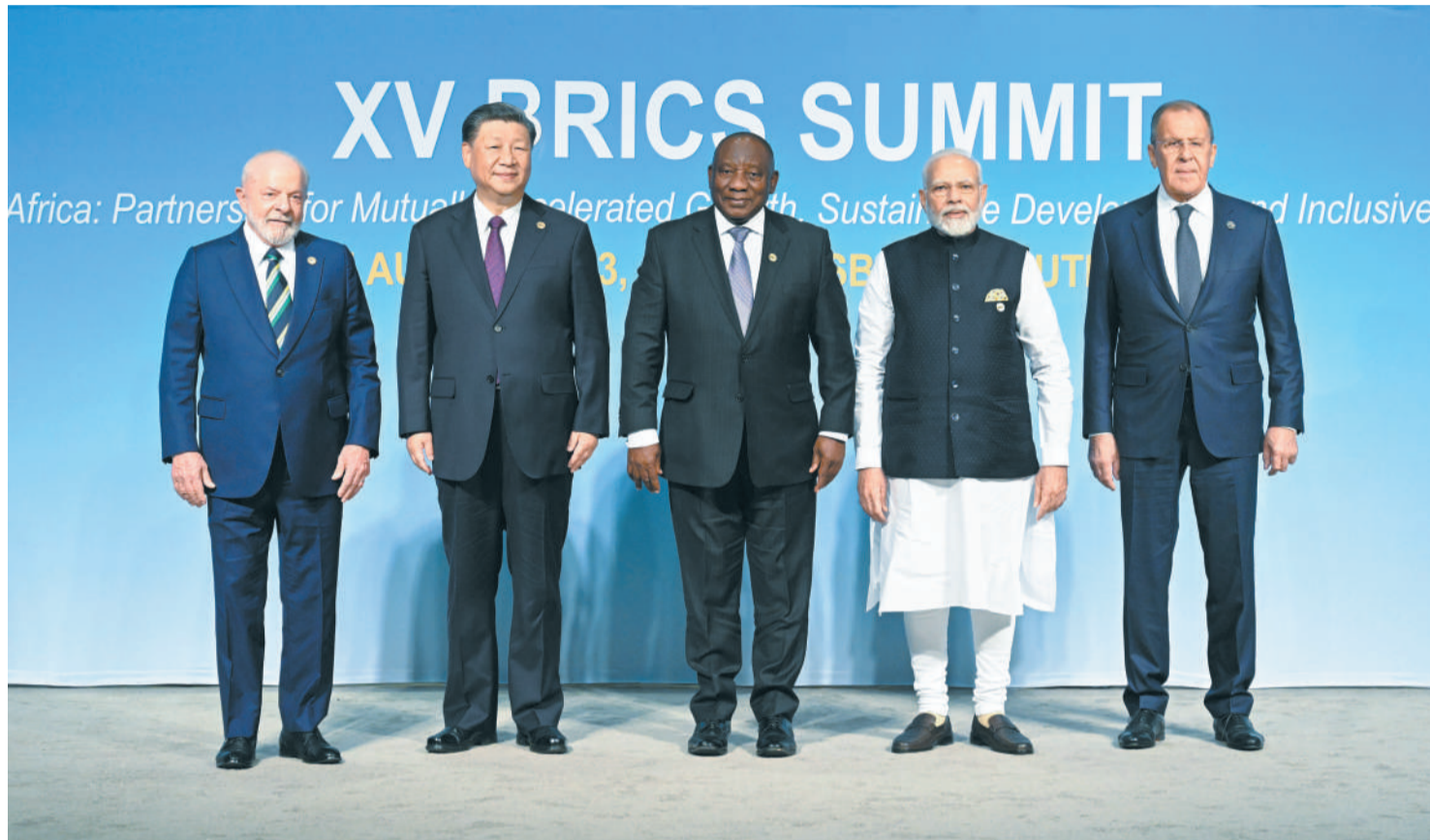
当地时间8月23日上午，金砖国家领导人第十五次会晤在约翰内斯堡杉藤会议中心举行。南非总统拉马福萨主持会晤。中国国家主席习近平、巴西总统卢拉、印度总理莫迪和俄罗斯总统普京（线上）出席。这是会晤期间，五国领导人集体合影。

科技日报约翰内斯堡8月23日电（记者冯志文）当地时间8月23日上午，金砖国家领导人第十五次会晤在约翰内斯堡杉藤会议中心举行。南非总统拉马福萨主持会晤。中国国家主席习近平、巴西总统卢拉、印度总理莫迪和俄罗斯总统普京（线上）出席。五国领导人围绕“金砖与非洲：深化伙伴关系，促进彼此增长，实现可持续发展，加强包容性多边主义”主题，就金砖合作及共同关心的重大国际问题深入交换意见，达成广泛共识。