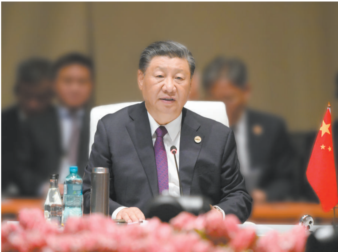
当地时间8月23日上午，金砖国家领导人第十五次会晤在约翰内斯堡杉藤会议中心举行。南非总统拉马福萨主持会晤。中国国家主席习近平、巴西总统卢拉、印度总理莫迪和俄罗斯总统普京（线上）出席。习近平发表题为《团结协作谋发展 勇于担当促和平》的重要讲话。