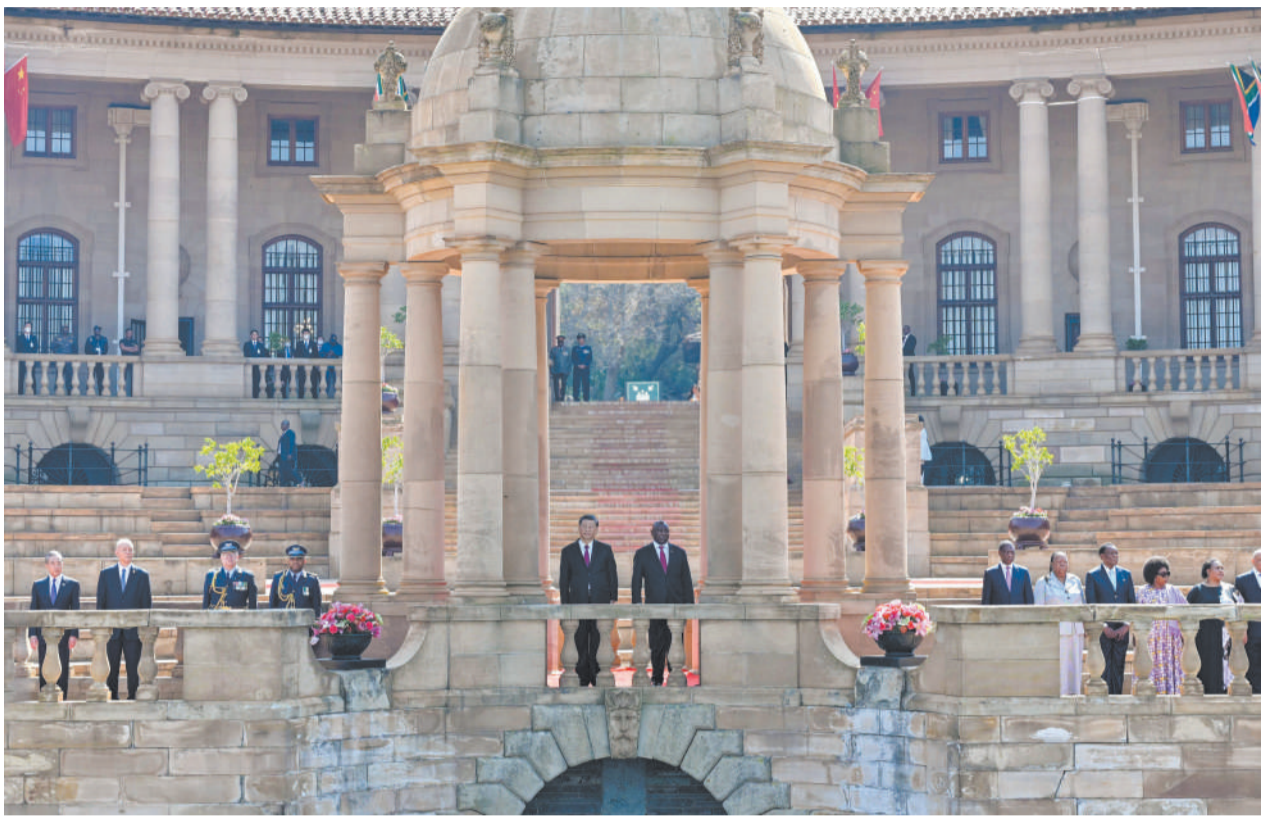
当地时间8月22日上午,正在南非进行国事访问的国家主席习近平在比勒陀利亚总统府同南非总统拉马福萨会谈前,拉马福萨在总统府广场为习近平举行欢迎仪式。