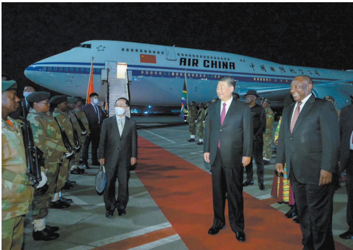
当地时间8月21日晚,国家主席习近平抵达约翰内斯堡,出席金砖国家领导人第十五次会晤并对南非进行国事访问。这是习近平在机场受到南非总统拉马福萨等热情迎接。