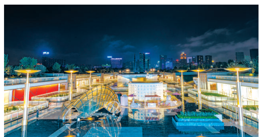
夜色中的成都流光溢彩,美轮美奂。第31届世界大学生夏季运动会在这座古老而又充满现代感的城市举行,世界各地的目光将聚焦在这座越夜越美的大运之城——成都!图为7月25日拍摄的成都夜景。

碳魔方”投放易拉罐、矿泉水瓶等可回收物品,获赠低碳卫生证书,还可以骑上“动力单车”,点亮大运主题图案能量墙,助“燃”成都大运会。在赛事打卡区,参与者可打卡羽毛球、乒乓球、射箭、篮球等大运赛事项目,感受运动魅力。演艺区则准备了3大主题展演,包含“活力成都”运动主题展演、“千年天府”文化主题展演、“乐动成都”音乐主题活动等。值得一提的是,该活动大量使用低碳环保、可循环的制作材料,契合成都大运会“绿色、智慧、活力、共享”的办赛理念。