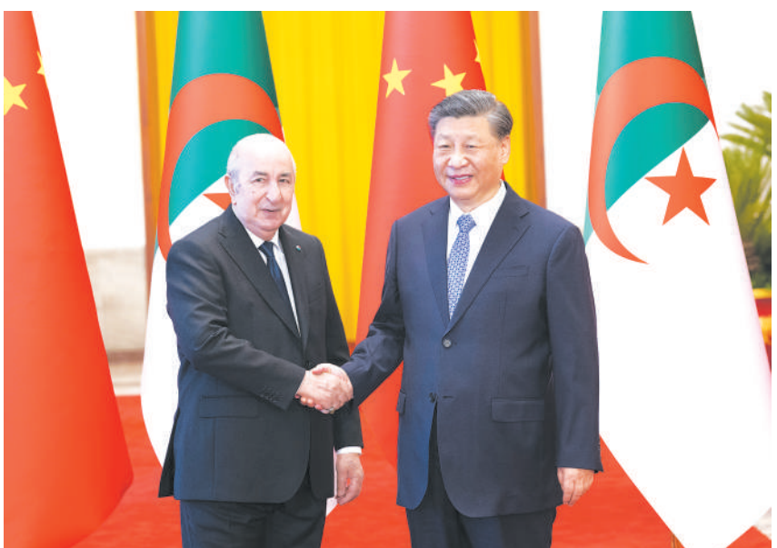
7月18日下午，国家主席习近平在北京人民大会堂同来华进行国事访问的阿尔及利亚总统特本举行会谈。这是会谈前，习近平在人民大会堂北大厅为特本举行欢迎仪式。