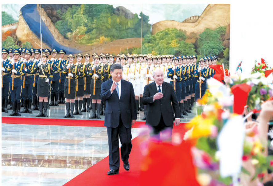
7月18日下午，国家主席习近平在北京人民大会堂同来华进行国事访问的阿尔及利亚总统特本举行会谈。这是会谈前，习近平在人民大会堂北大厅为特本举行欢迎仪式。