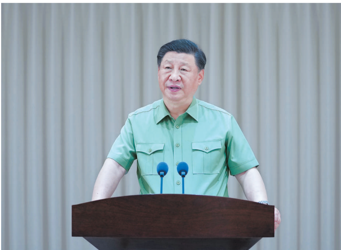
七月六日，中共中央总书记、国家主席、中央军委主席习近平视察东部战区机关，代表党中央和中央军委，向东部战区全体官兵致以诚挚问候。这是习近平发表重要讲话。