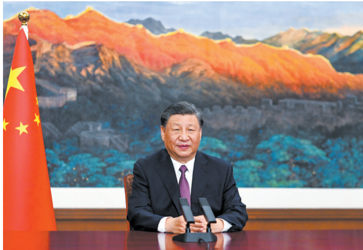
五月二十四日，国家主席习近平应邀以视频方式出席欧亚经济联盟第二届欧亚经济论坛全会开幕式并致辞。