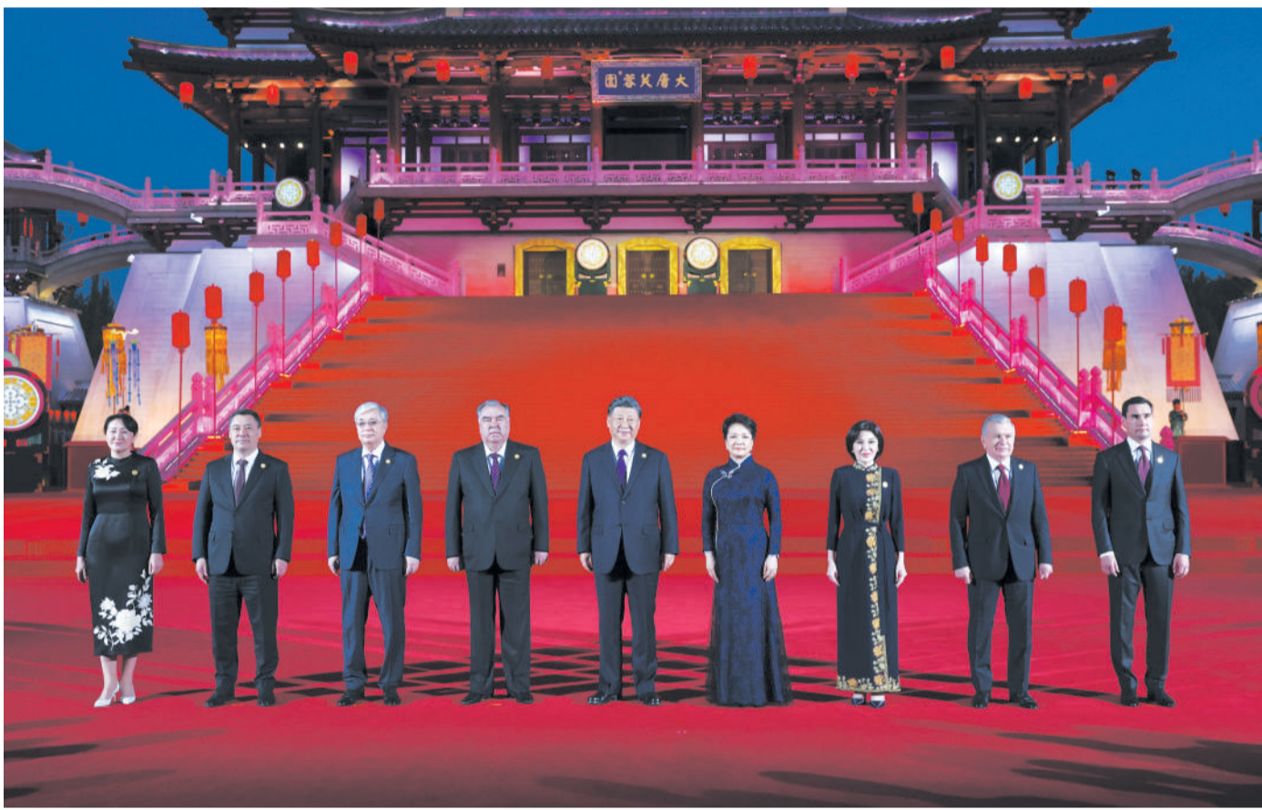
5月18日晚，国家主席习近平和夫人彭丽媛在陕西省西安市大唐芙蓉园为出席中国—中亚峰会的中亚国家元首夫妇举行欢迎仪式和欢迎宴会。宴会后，习近平夫妇同贵宾们共同观看中国同中亚国家人民文化艺术年暨中国—中亚青年艺术节开幕式演出。这是习近平夫妇在紫云楼前同贵宾合影留念。