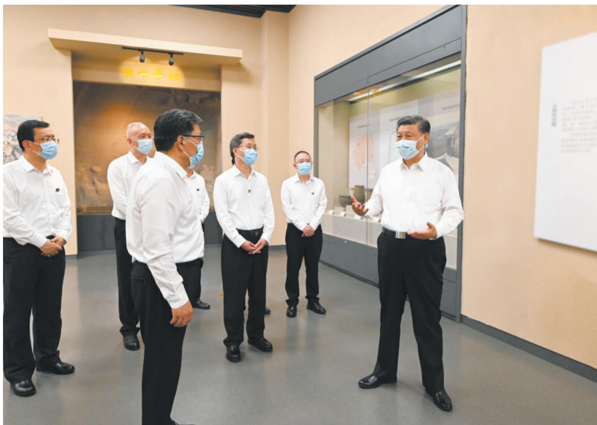
5月16日下午，中共中央总书记、国家主席、中央军委主席习近平在前往陕西西安主持中国—中亚峰会途中，在山西运城博物馆考察。

新华社陕西西安/山西运城5月17日电 中共中央总书记、国家主席、中央军委主席习近平在听取陕西省委和省政府工作汇报时强调，陕西在推进中国式现代化建设中要有勇立潮头、争当时代弄潮儿的志向和气魄，奋力追赶、敢于超越，在西部地区发挥示范作用。要完整、准确、全面贯彻新发展理念，紧紧围绕高质量发展这个首要任务，着眼全国发展大局，立足陕西实际，发挥自身优势，明确主攻方向，主动融入和服务构建新发展格局，努力在实现科技自立自强、构建现代化产业体系、促进城乡区域协调发展、扩大高水平对外开放、加强生态环境保护等方面实现新突破，奋力谱写中国式现代化建设的陕西篇章。 5月17日，习近平在西安主持中国—中亚峰会前夕，专门听取陕西省委和省政府工作汇报，省委书记赵一德汇报，省长赵刚等参加汇报会。习近平发表了重要讲话，对陕西各项工作取得的成绩给予肯定。