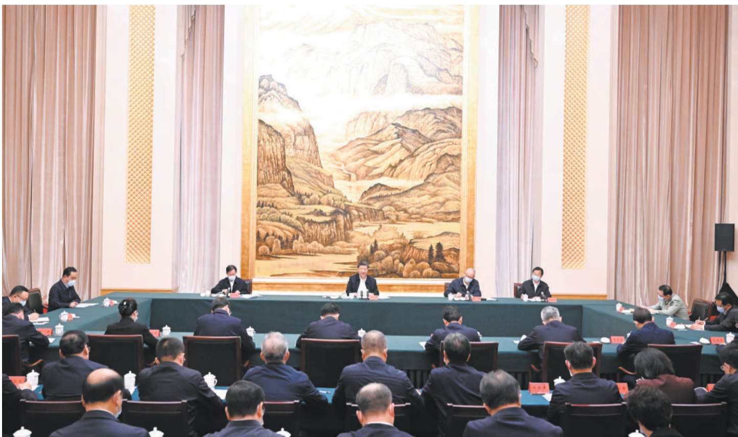
5月17日上午，中共中央总书记、国家主席、中央军委主席习近平在陕西西安主持中国—中亚峰会前夕，专门听取陕西省委和省政府工作汇报，发表了重要讲话。