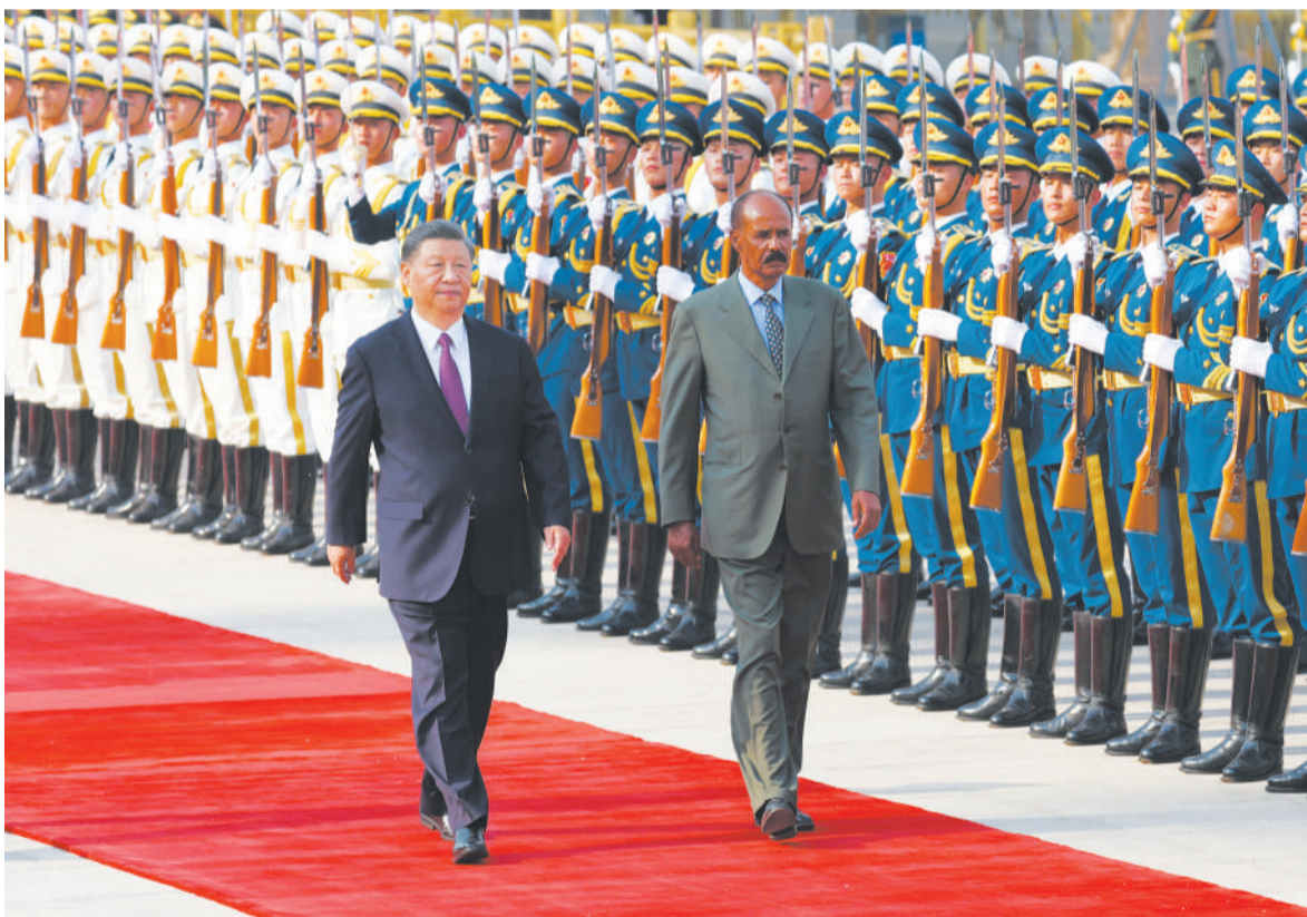
五月十五日下午,国家主席习近平在北京人民大会堂同厄立特里亚总统伊萨亚斯举行会谈。这是会谈前,习近平在人民大会堂东门外广场为伊萨亚斯举行欢迎仪式。