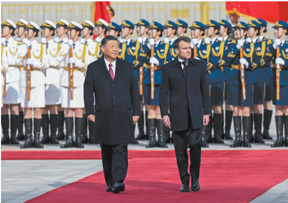
四月六日下午，国家主席习近平在北京人民大会堂同法国总统马克龙举行会谈。

新华社北京4月6日电（记者刘华）4月6日下午，国家主席习近平在人民大会堂同法国总统马克龙举行会谈。 习近平欢迎马克龙再次访华。习近平指出，当今世界正在经历深刻的历史之变，中法作为联合国安理会常任理事国和具有独立自主传统的大国，作为世界多极化、国际关系民主化的坚定推动者，有能力、有责任超越分歧和束缚，坚持稳定、互惠、开拓、向上的中法全面战略伙伴关系大方向，践行真正的多边主义，维护世界和平、稳定、繁荣。 习近平积极评价中法关系保持积极稳健发展势头，强调指出，稳定性是中法关系的突出特征和宝贵财富，值得双方精心呵护。双方要用好两国全方位、高水平沟通渠道，保持两国元首密切沟通，今年年内举行中法战略、经济财金、人文交流三大高级别对话机制新一次会议。双方要相互尊重对方主权和领土完整，尊重对方核心利益，妥善处理管控分歧。要坚持互利互惠、共同发展。中国正在大力推进高