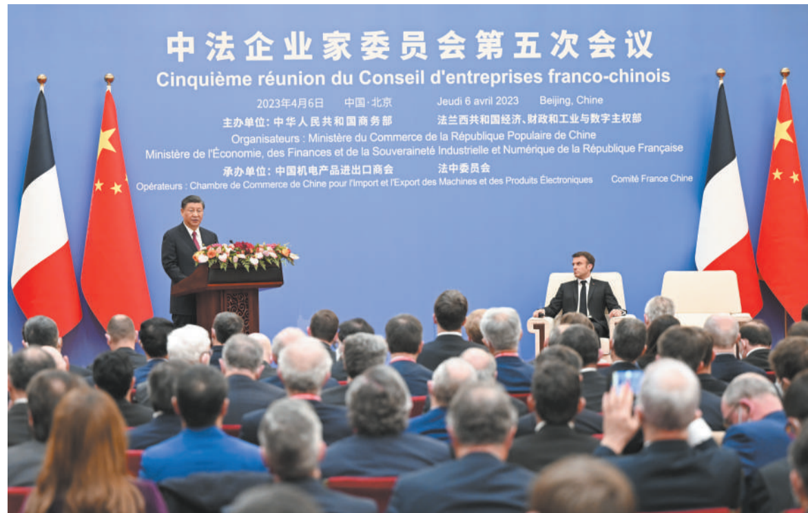
四月六日下午，国家主席习近平在北京同法国总统马克龙共同出席中法企业家委员会第五次会议闭幕式并致辞。

新华社北京4月6日电（记者刘华）4月6日下午，国家主席习近平在北京同法国总统马克龙共同出席中法企业家委员会第五次会议闭幕式并致辞。 习近平指出，世界正发生深刻复杂变化。面对困难和挑战，中法两国坚持