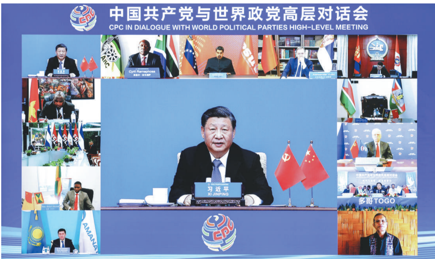
3月15日,中共中央总书记、国家主席习近平在北京出席中国共产党与世界政党高层对话会,并发表题为《携手同行现代化之路》的主旨讲话。