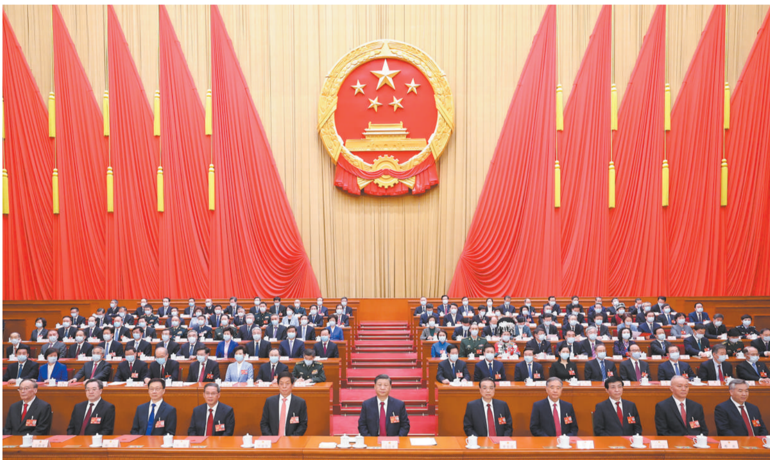
3月13日,第十四届全国人民代表大会第一次会议在北京人民大会堂闭幕。中共中央总书记、国家主席、中央军委主席习近平发表重要讲话。