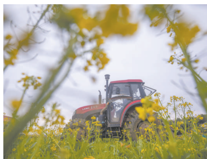
本版责编 胡兆珀 陈丹

2月5日，厦门市政府印发出台《厦门市关于大力提振市场信心推动经济平稳向好若干措施》，进一步提振市场信心，激发市场主体活力。（下转第二版）