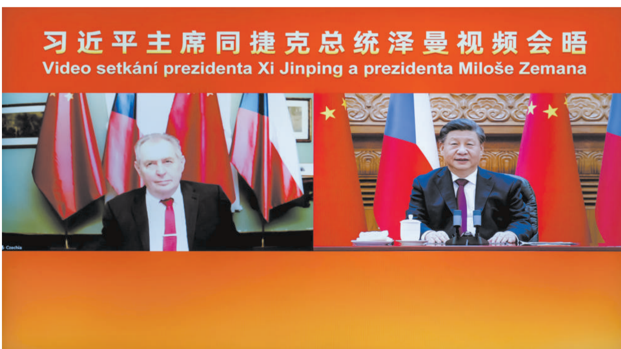
1月9日下午，国家主席习近平在北京同捷克总统泽曼举行视频会晤。