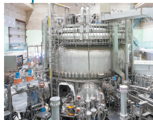
全超导托卡马克(EAST)是我国自行设计研制的世界上第一个全超导非圆截面托卡马克核聚变实验装置,又称“东方超环”或“人造小太阳”。图为全超导托卡马克(EAST)全景。