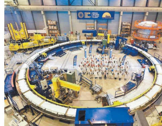
国际热核聚变实验堆(ITER)是目前世界上最大的核聚变计划。图为ITER施工现场。