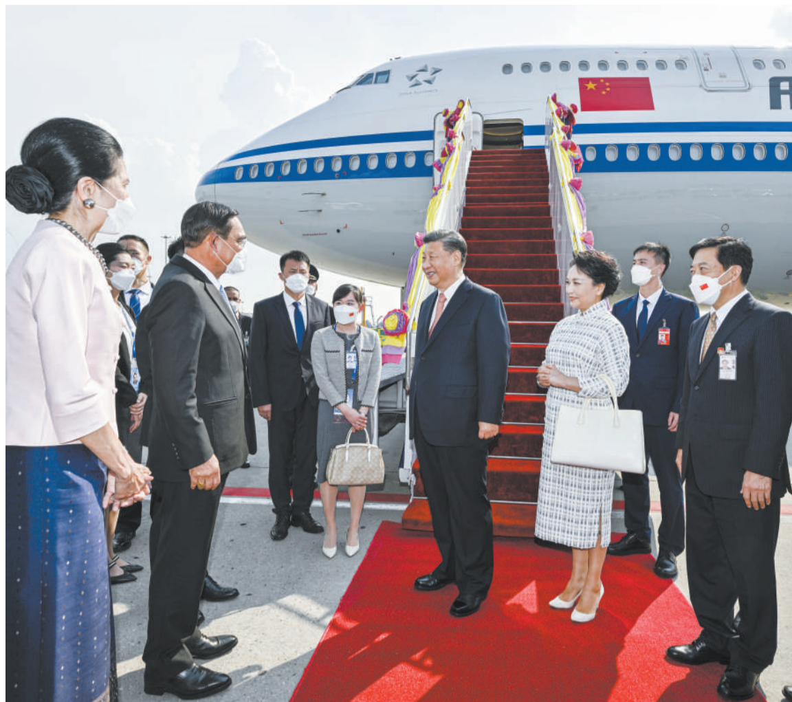
当地时间十一月十七日下午，国家主席习近平乘专机抵达泰国曼谷，出席亚太经合组织第二十九次领导人非正式会议并对泰国进行访问。这是习近平和夫人彭丽媛乘坐的专机抵达曼谷素万那普国际机场时，泰国总理巴育夫妇、副总理兼外长敦夫、文化部部长伊提蓬夫妇等热情迎接。