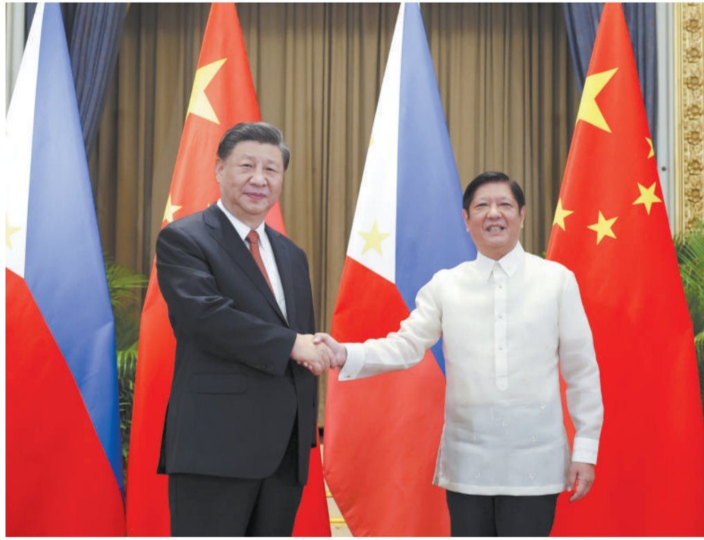
当地时间11月17日下午，国家主席习近平在泰国曼谷会见菲律宾总统马科斯。

新华社曼谷11月17日电（记者耿学鹏 毛鹏飞）当地时间11月17日下午，国家主席习近平在泰国曼谷会见菲律宾总统马科斯。