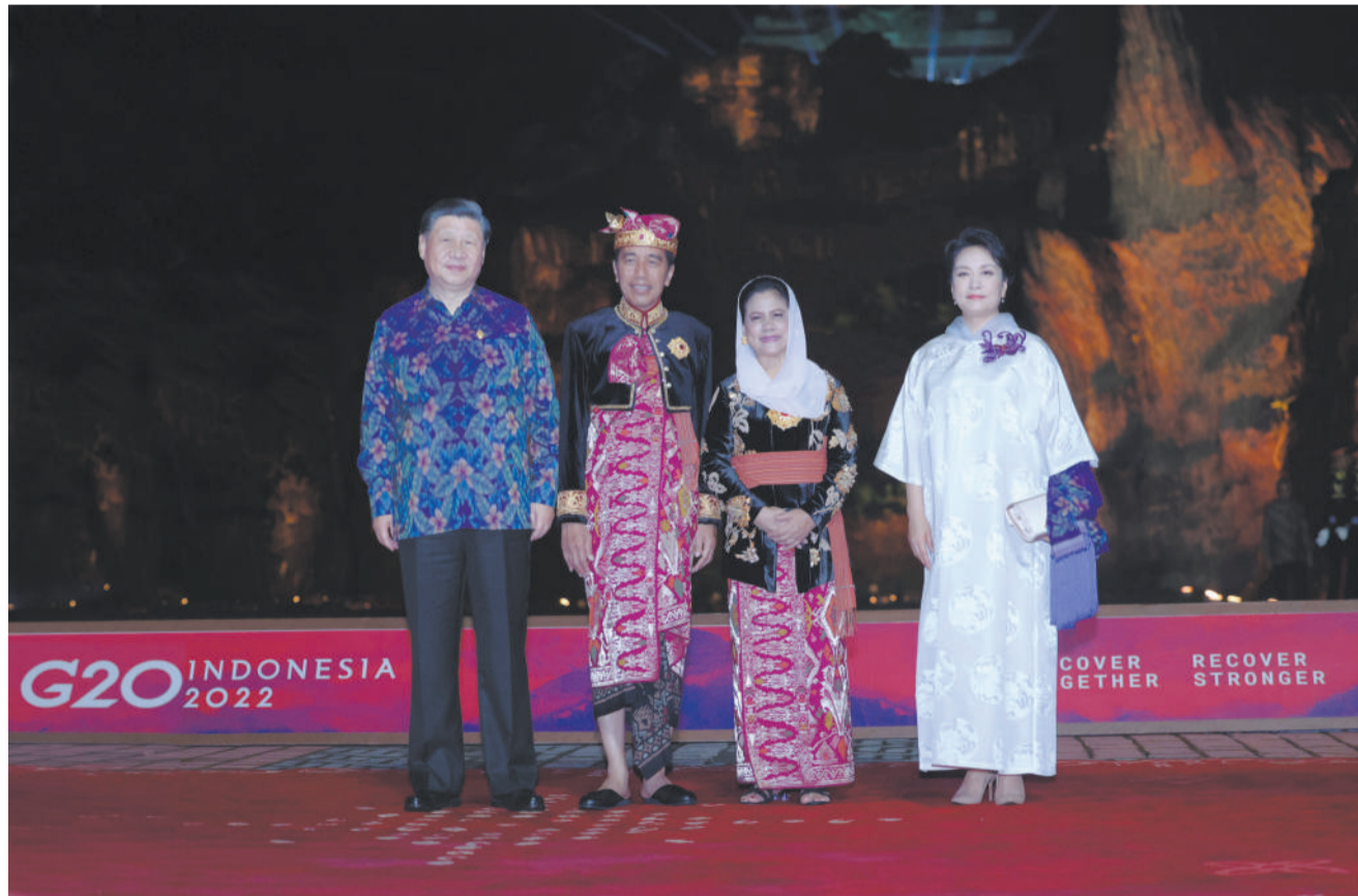
当地时间11月15日晚,国家主席习近平和夫人彭丽媛在印度尼西亚巴厘岛出席二十国集团领导人峰会欢迎晚宴。这是习近平主席夫妇在晚宴前同印度尼西亚总统佐科夫妇合影。