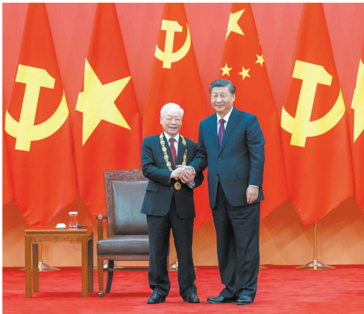
十月三十一日，中共中央总书记、国家主席习近平在北京人民大会堂向越共中央总书记阮富仲授予中华人民共和国“友谊勋章”，并举行隆重颁授仪式。