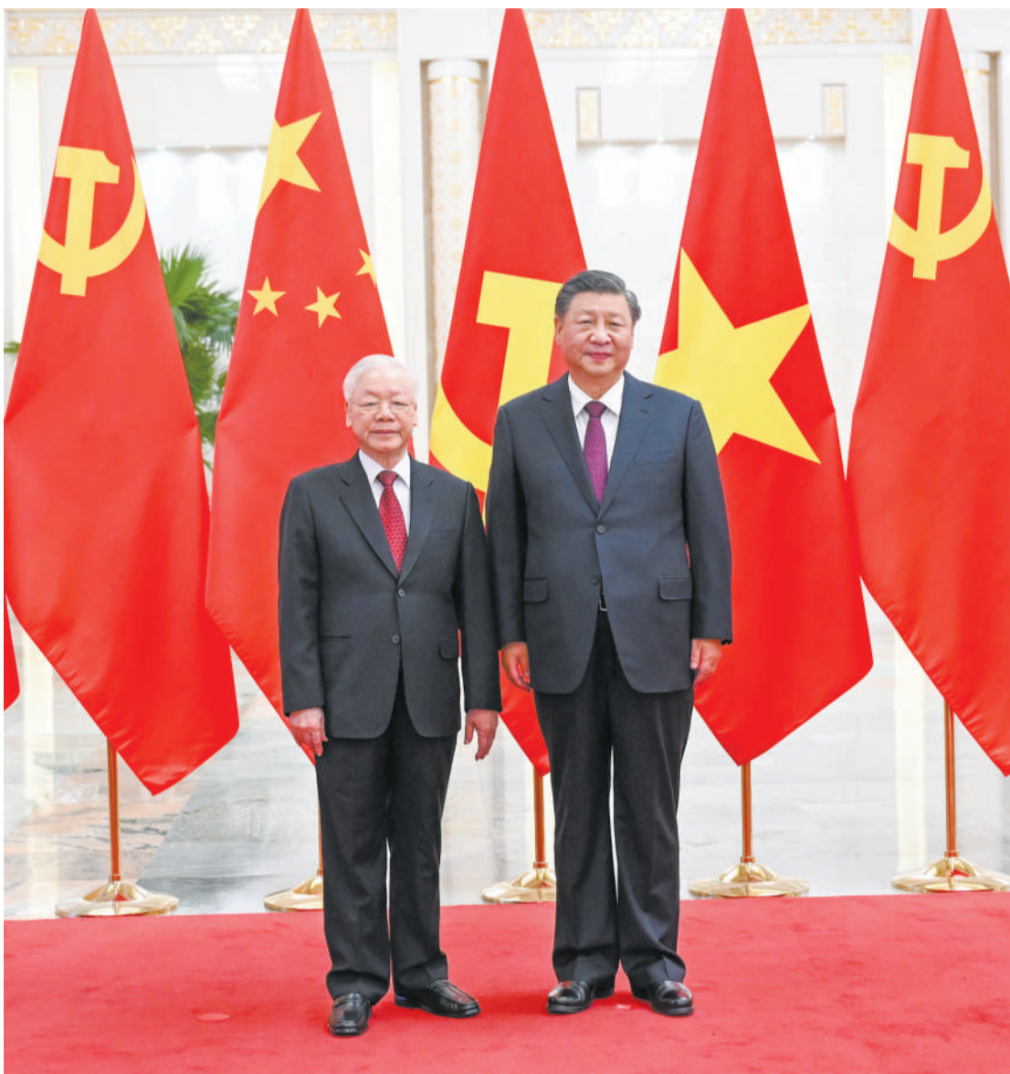
左图 10月31日，中共中央总书记、国家主席习近平在北京人民大会堂同越共中央总书记阮富仲举行会谈。这是会谈前，习近平在人民大会堂北大厅为阮富仲举行欢迎仪式。