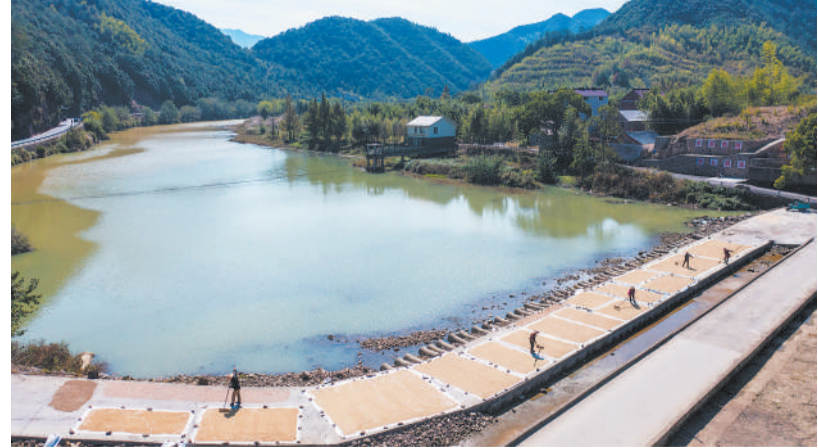
近期，浙江省杭州市富阳区富春江畔的万亩稻田进入收获期，鱼米之乡呈现一派热闹繁忙的丰收景象。图为10月20日，杭州市富阳区湖源乡石龙村的农民在壠源溪畔晾晒收获的稻谷(无人机照片)。