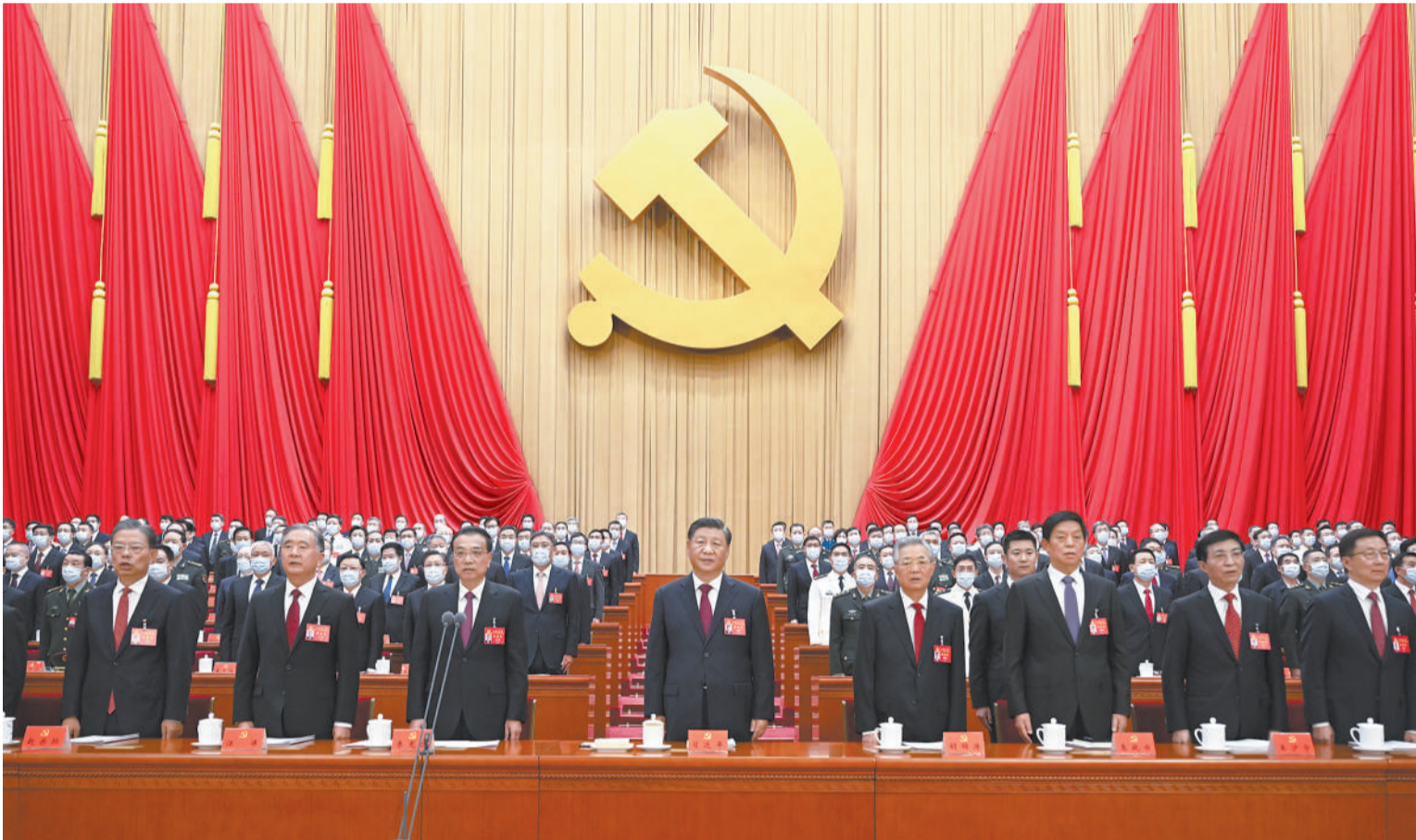
10月16日，中国共产党第二十次全国代表大会在北京人民大会堂开幕。这是习近平、李克强、栗战书、汪洋、王沪宁、赵乐际、韩正、胡锦涛在主席台上。