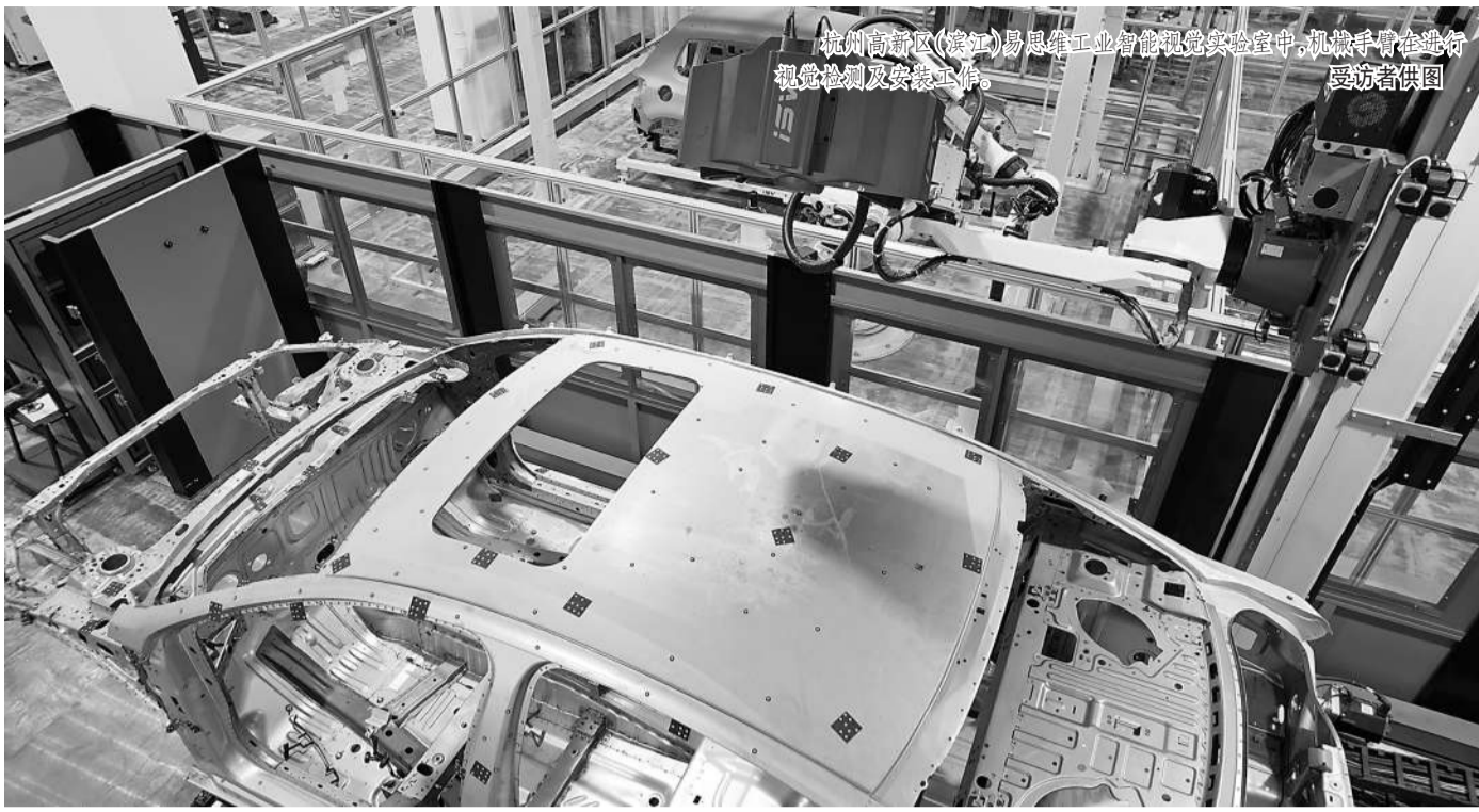
杭州高新区(滨江)易思睿工业互联网智能实验室中,机械手臂在进行视觉检测及安装工作。

杭州高新区(滨江)正进一步强链延链补链,全力打造视觉智能、网络通信、智能装备、生命健康等重点产业链,持续完善以物联网产业园等产业平台和众多特色产业园、加速器、孵化器、众创空间等为载体,以“一区多园”机制为补充的产业