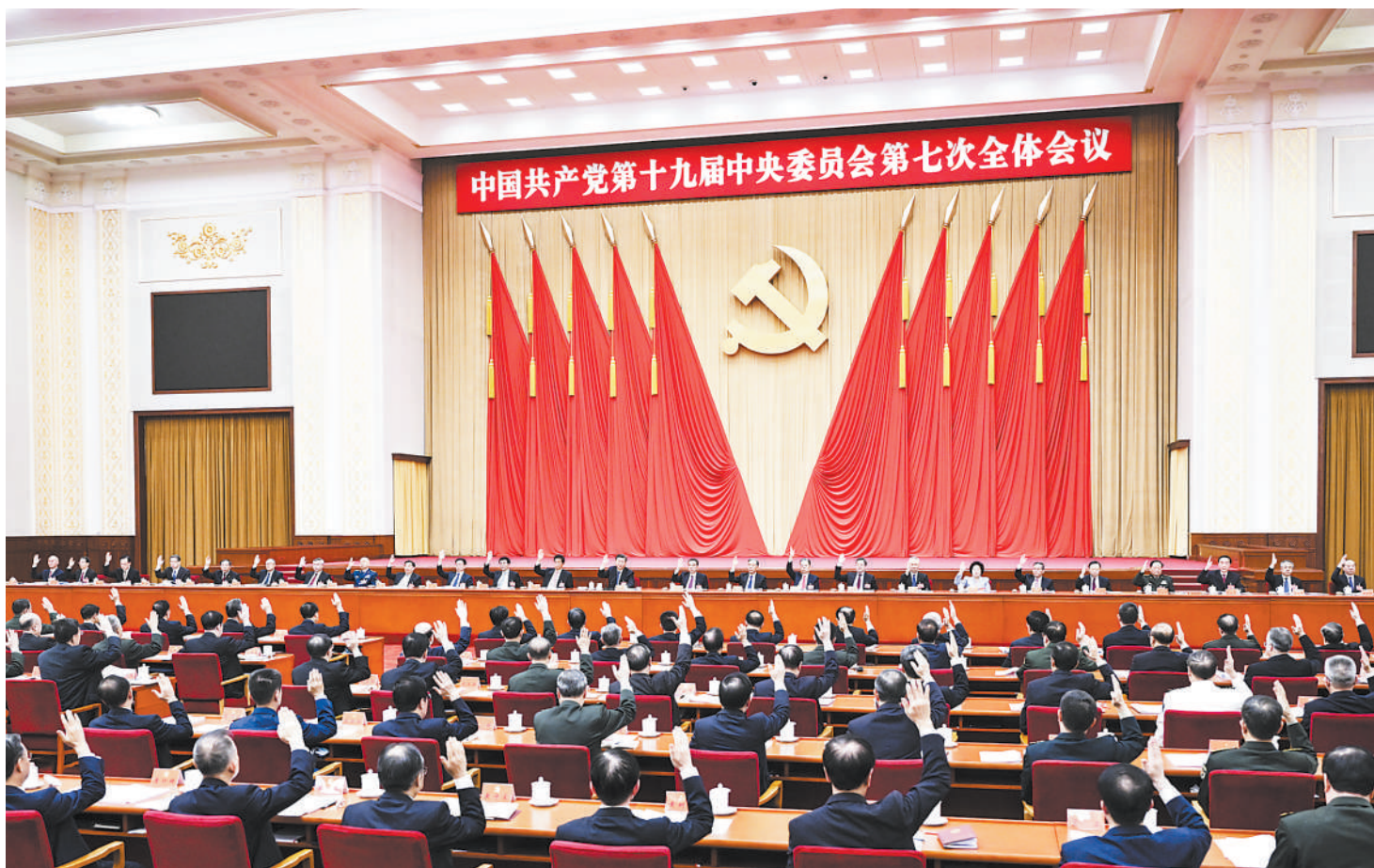
中国共产党第十九届中央委员会第七次全体会议，于2022年10月9日至12日在北京举行。中央政治局主持会议。