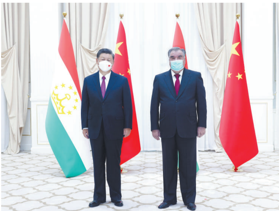
当地时间9月15日上午，国家主席习近平在撒马尔罕国宾馆会见塔吉克斯坦总统拉赫蒙。