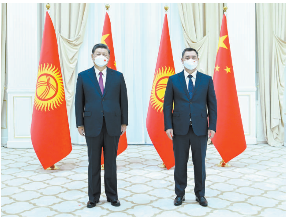
当地时间9月15日上午，国家主席习近平在撒马尔罕国宾馆会见吉尔吉斯斯坦总统扎帕罗夫。