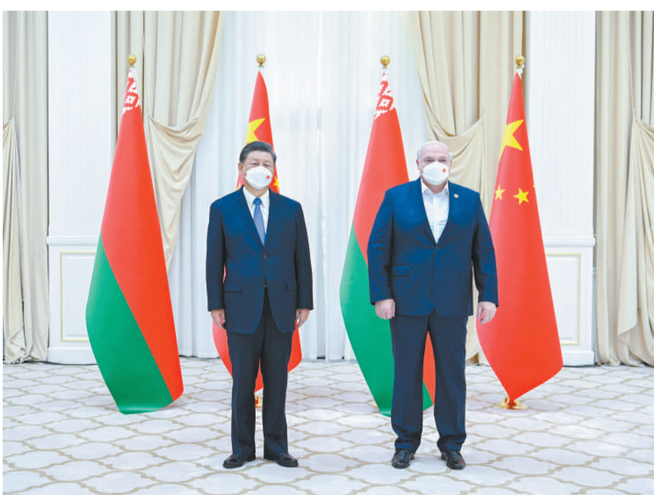
当地时间9月15日下午，国家主席习近平在撒马尔罕国宾馆会见白俄罗斯总统卢卡申科。