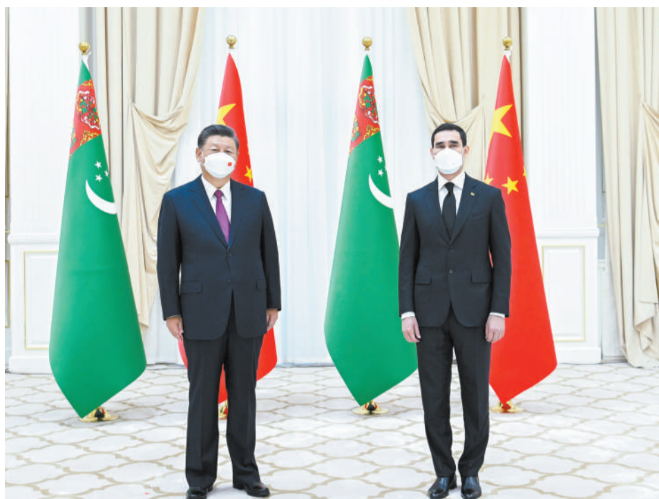
当地时间9月15日上午，国家主席习近平在撒马尔罕国宾馆会见土库曼斯坦总统谢尔达尔·别尔德穆哈梅多夫。