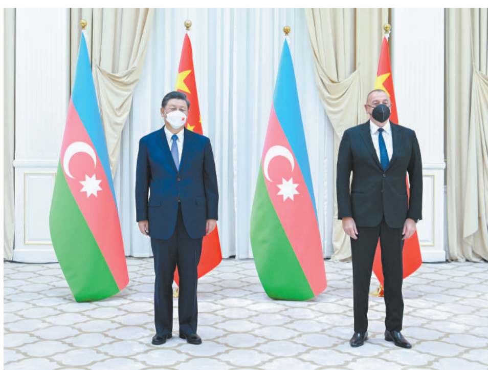
当地时间9月15日下午，国家主席习近平在撒马尔罕国宾馆会见阿塞拜疆总统阿利耶夫。