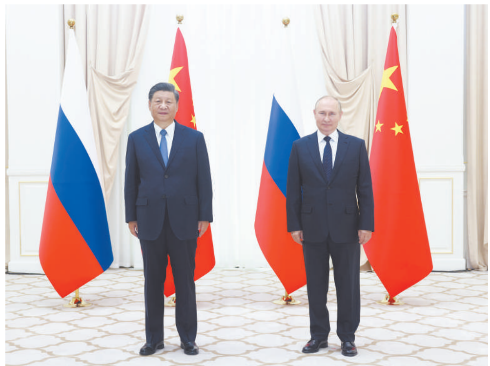
当地时间9月15日下午，国家主席习近平在撒马尔罕同俄罗斯总统普京举行双边会见，就中俄关系和共同关心的国际和地区问题交换意见。

新华社乌兹别克斯坦撒马尔罕9月15日电（记者范伟国 刘华）当地时间15日下午，国家主席习近平在撒马尔罕同俄罗斯总统普京举行双边会见，就中俄关系和共同关心的国际和地区问题交换意见。 习近平指出，今年以来，中俄保持了卓有成效的战略沟通。两国各领域合作稳步推进，体育交流年活动有序开展，地方合作和人文交流更加热络，在国际舞台上密切协调，维护国际关系基本准则。面对世界之变、时代之变、历史之变，中方愿同俄方一道努力，体现大国担当，发挥引领作用，为变幻莫测的世界注入稳定性。 习近平强调，中方愿同俄方在涉及彼此核心利益问题上相互有力支持，深化贸易、农业、互联互通等领域务实合作。 （下转第四版）