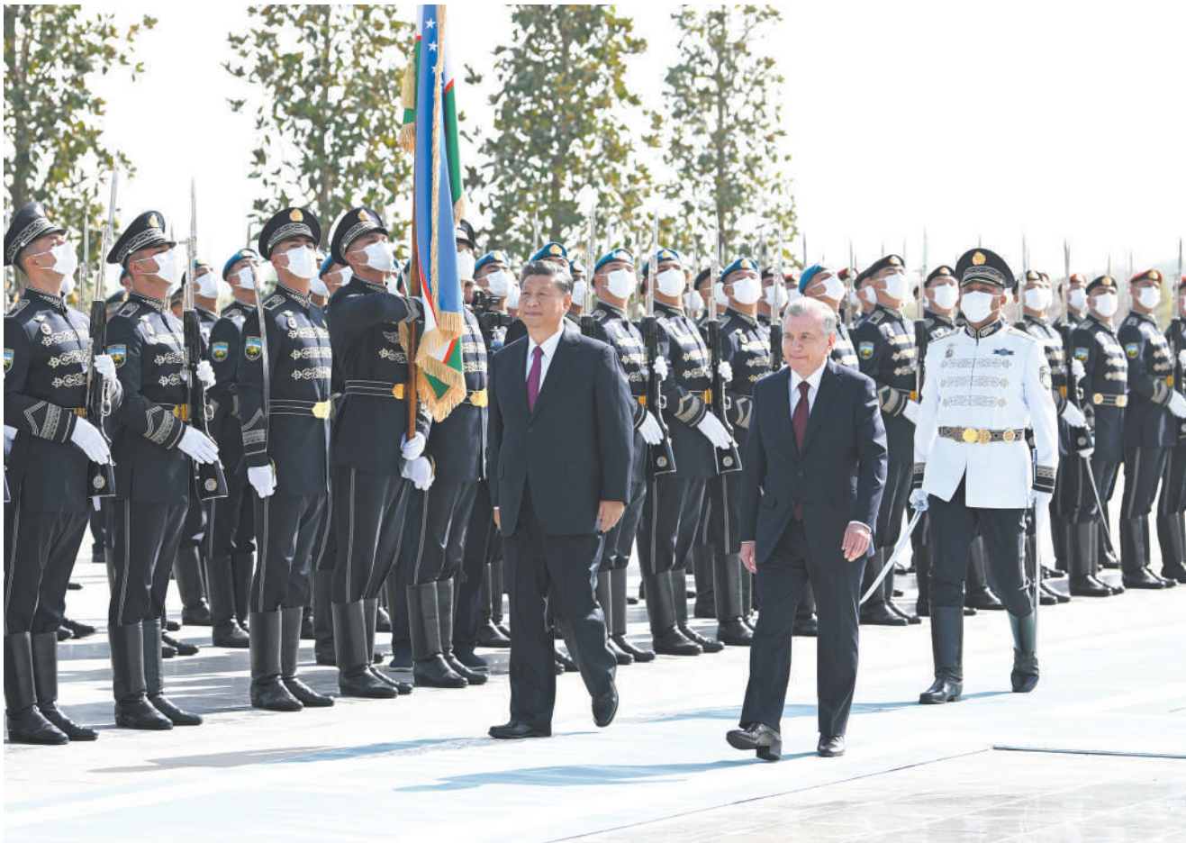
当地时间9月15日，国家主席习近平在撒马尔罕同乌兹别克斯坦总统米尔济约耶夫会谈。会谈前，米尔济约耶夫为习近平举行隆重欢迎仪式。