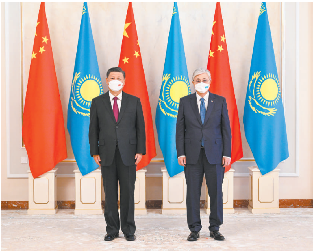
当地时间9月14日下午，国家主席习近平乘专机抵达努尔苏丹，开始对哈萨克斯坦共和国进行国事访问。习近平主席同托卡耶夫总统举行正式会谈。这是会谈前两国元首合影。

新华社努尔苏丹9月14日电（记者倪四义 刘恺）当地时间9月14日下午，国家主席习近平乘专机抵达努尔苏丹，开始对哈萨克斯坦共和国进行国事访问。