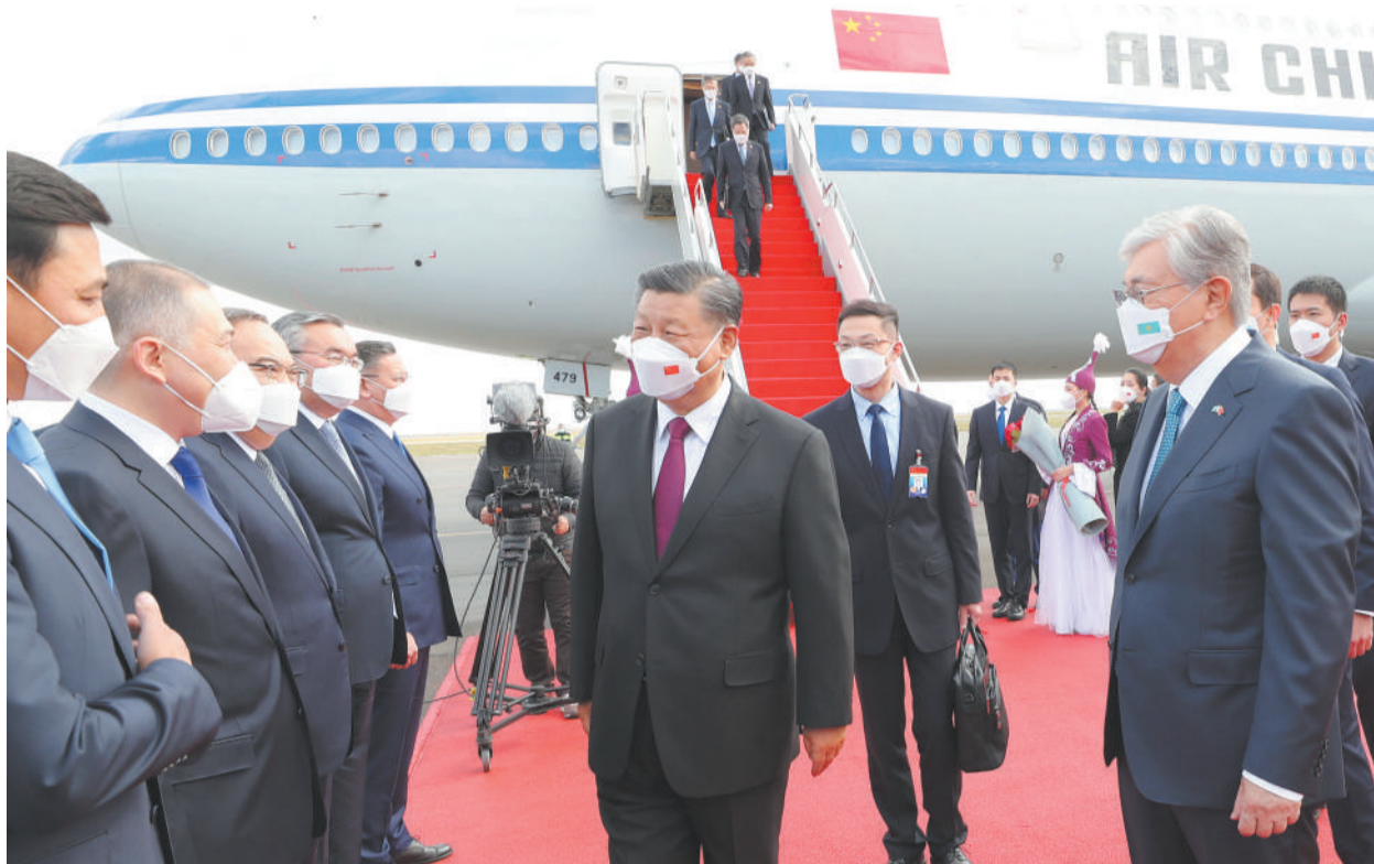
当地时间9月14日下午，国家主席习近平乘专机抵达努尔苏丹，开始对哈萨克斯坦共和国进行国事访问。这是哈萨克斯坦总统托卡耶夫率政府副总理兼外长特列乌别尔季、努尔苏丹市市长库里吉诺夫等高级官员在机场热情迎接。