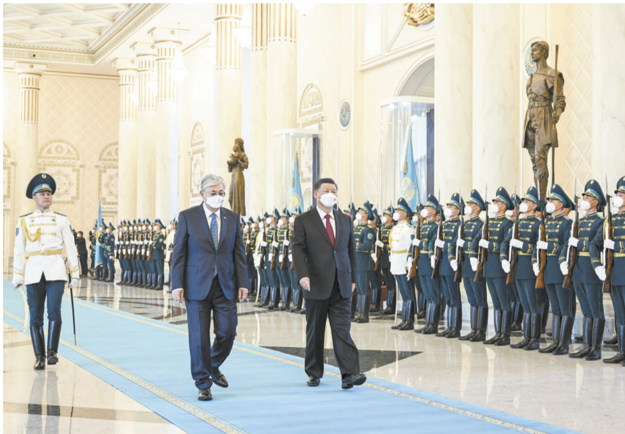
当地时间9月14日下午，国家主席习近平乘专机抵达努尔苏丹，开始对哈萨克斯坦共和国进行国事访问。托卡耶夫总统为习近平主席举行隆重欢迎仪式。这是习近平在托卡耶夫陪同下检阅仪仗队。