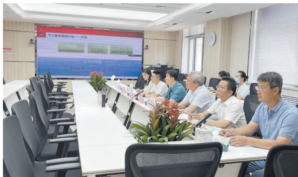
中层干部社会公开招聘网络面试