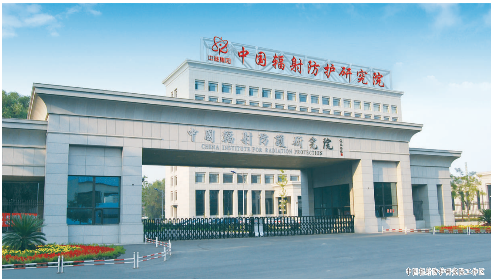
中国辐射防护研究院工作区

中辐院坚决贯彻落实国家创新驱动发展战略,坚持创新在发展全局中的核心地位,加大关键核心技术攻关力度,致力于打造辐射防护原创技术策源地,不断提高辐射防护核心技术供给能力,支撑高水平科技自立自强。