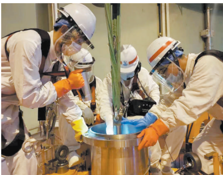
现场运维技术人员开展核检修服务