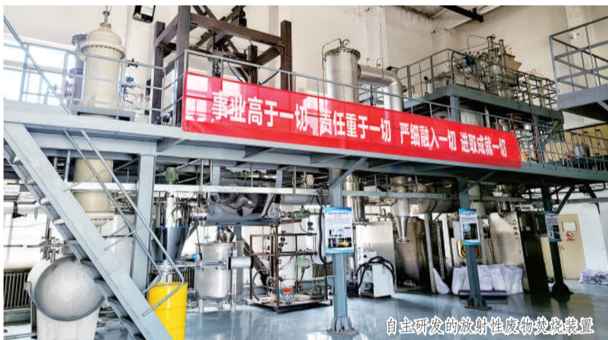
自主研发的放射性废物焚烧装置

强化战略规划引领。充分发挥中核环保战略规划院职能,结合“双碳”目标,不断提高立足“三新一高”发展要求的战略眼光、专业水平。启动“RP2030”计划,瞄准国际前沿,勇探技术无人区。凝练“弱项短板”等重大科研项目库,全面强化基础研究能力。