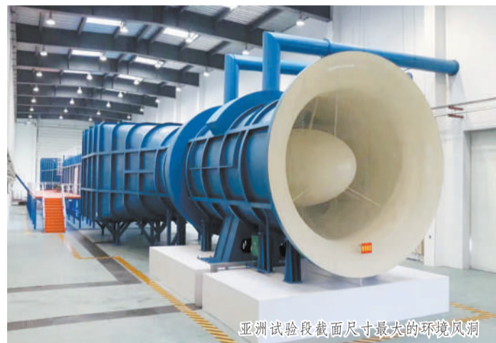
亚洲试验段截面尺寸最大的环境风洞