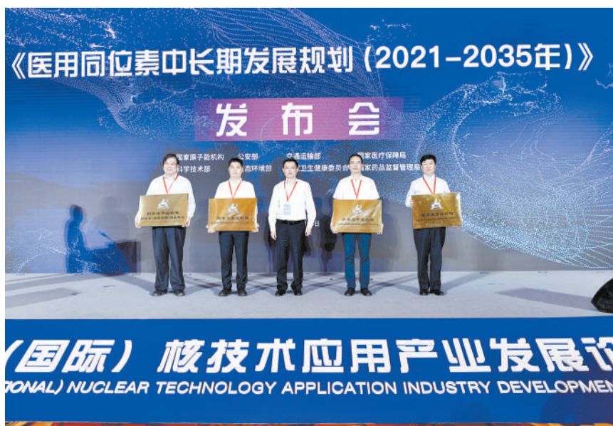
中辐院接受国家原子能机构授牌