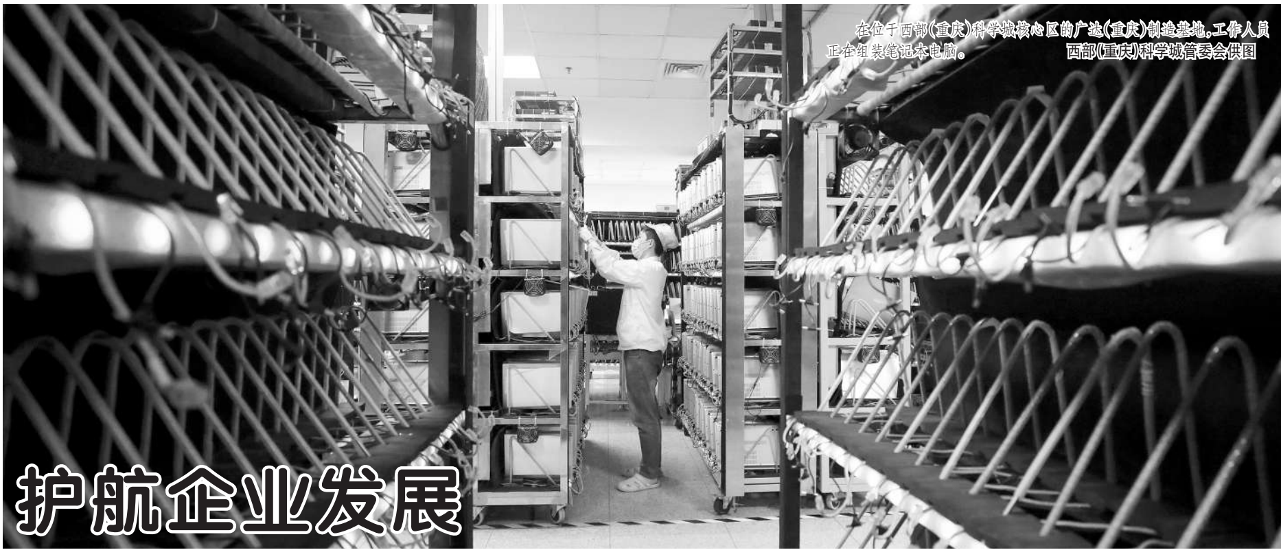
在位于西部(重庆)科学城核心区的广达(重庆)制造基地,工作人员正在组装笔记本电脑。