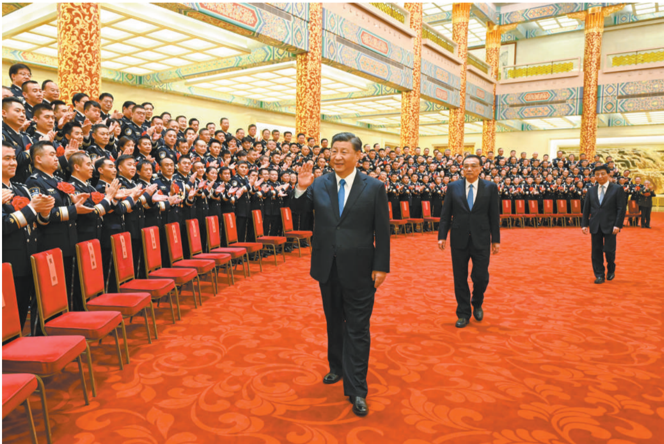
5月25日,党和国家领导人习近平、李克强、王沪宁等在北京人民大会堂会见全国公安系统英雄模范立功集体表彰大会代表。