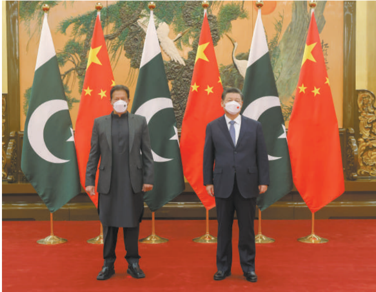
2月6日上午，国家主席习近平在北京人民大会堂会见来华出席北京2022年冬奥会开幕式的巴基斯坦总理伊姆兰·汗。

新华社北京2月6日电 国家主席习近平2月6日上午在人民大会堂会见来华出席北京2022年冬奥会开幕式的巴基斯坦总理伊姆兰·汗。 习近平指出，刚刚过去的2021年对中亚关系意义非凡。两国庆祝建交70周年，回顾历史，总结经验，以更坚定的信心开创中亚关系未来。中方愿同巴方一道，加快构建新时代更加紧密的中巴命运共同体，为两国人民创造福祉，为地区合作提供动力，为世界和平贡献力量。 习近平强调，世界进入动荡变革期，中亚关系战略意义更加突出。中巴两国要弘扬互信互助、携手合作的传统，开展更加广泛深入的战略合作。中方坚定支持巴方捍卫国家独立、主权、尊严，打击恐怖主义，愿同巴方对接发展战略，推进中巴经济走廊建设向深入发展，确保重大项目顺利实施，拓展科技、农业、社会民生等领域合作，建设绿色、健康、数字走廊，支持巴方推进工业化进程，以提升可持续发展能力。中方在国际事务中主持公道正义，不惹事，也不怕事。我们有能力、有信心维护好自身的权利、安全、发展利益。中方愿同巴方加强在联合国等多边场合的协调配合，发出更多正义之声，维护世界和平稳定。双方应该积极推动落实全球发展倡议，构建人类命运共同体。 伊姆兰·汗祝贺中方成功举办叹为观止的北京冬奥会开幕式，感谢中方为巴基斯坦抗击新冠肺炎疫情提供宝贵帮助，中方提供的疫苗不仅拯救了巴人民，也拯救了巴经济。当前国际政治经济形势发生深刻复杂变化，但任何势力都无法阻挡中国前进的步伐，中国发展壮大势不可挡。中国消除了绝对贫困，这是人类社会所能期盼的最伟大成就，中国治国理政经验也最值得各国学习借鉴。巴中是全天候朋友，任何时候巴方都将同中方坚定站在一起。巴方愿积极推进中巴经济走廊第二阶段建设，同中方加强工业、农业、信息技术等领域合作，助力巴提高经济发展水平。巴方愿就阿富汗等地区问题同中方加强沟通协作，维护地区安全稳定。 丁薛祥、杨洁篪、王毅、何立峰等参加会见。