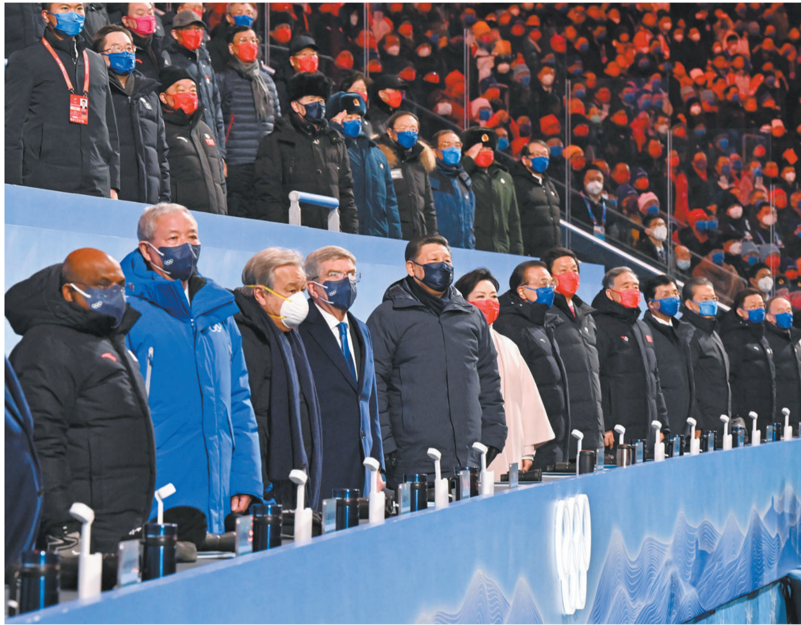
2月4日晚，北京第二十四届冬季奥林匹克运动会开幕式在国家体育场隆重举行。习近平、李克强、栗战书、汪洋、王沪宁、赵乐际、韩正、王岐山等党和国家领导人出席开幕式。

新华社北京2月4日电 筑梦冰雪，同向未来。2022年2月4日晚，举世瞩目的北京第二十四届冬季奥林匹克运动会开幕式在国家体育场隆重举行。国家主席习近平出席开幕式并宣布本届冬奥会开幕。中华文明与奥林匹克运动再度携手，奏响全人类团结、和平、友谊的华美乐章。