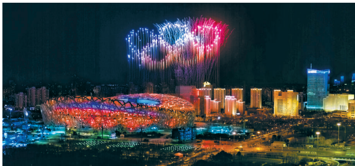
二月四日晚，第二十四届冬季奥林匹克运动会开幕式在北京国家体育场举行。这是焰火表演。