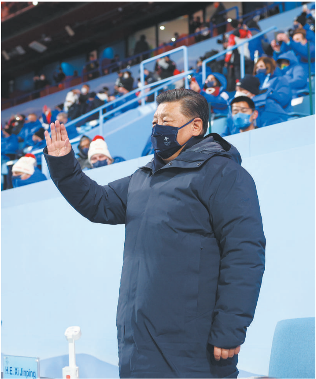
2月4日晚，北京第二十四届冬季奥林匹克运动会开幕式在国家体育场隆重举行。这是国家主席习近平在主席台上向大家挥手致意。

李克强栗战书汪洋王沪宁赵乐际韩正王岐山 国际奥委会主席巴赫 来自世界各地的领导人和贵宾等出席