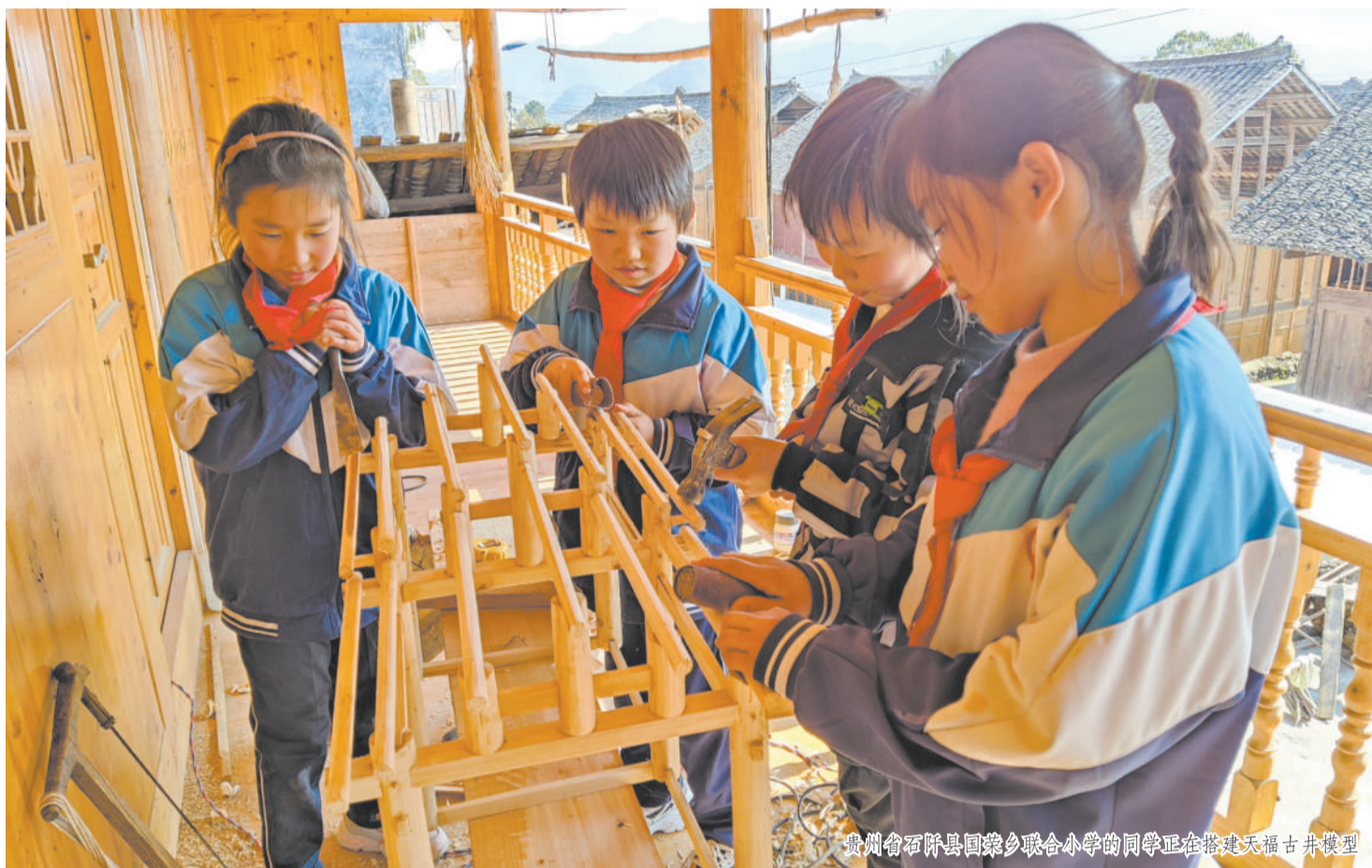
贵州省铜仁县同乐乡联合小学的同学正在搭建天福古井模型

在这场艺术和科技结合的奇妙之旅中，在这场东部和西部青少年携手的通力合作中，正在成长的青少年们，也对文化自信和可持续发展，有了更深刻的体悟。