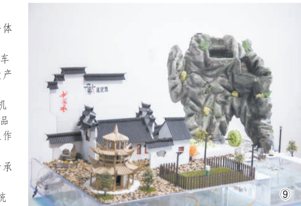
图① 小猪佩奇和他们制作的水磨车 图② 上海市静安区闸北第一中心小学的同学制作的声光电一体化作品——建筑可阅读，能源巧利用 图③ 育华冰冰车队的同学们正在组装自己的作品——冰冰车 图④ 北京市十一学校一分校的同学正在进行贵州楼上村遗产保护语音导览系统的制作与调试 图⑤ 来自成都的又双叻队和他们作品——自动水车春米机 图⑥ 清华大学附属小学清河分校的同学正在制作他们的参展作品 图⑦ 青海省西宁市湟中区康川学校的同学正在制作掐丝珐琅作品——高原精灵 图⑧ 贵州文澜队的同学进行作品——贵州屯堡建筑保护与传承最后调试 图⑨ 滨州实验学校同学制作的作品——水力农耕节能环保系统